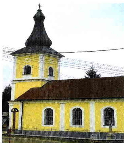
Kostol sv. Františka v Ružinej

Kostol v Ružinej z r. 1750 má patróna Sv. Františka z Assisi – je to jednodňová stavba dĺžka 14,45 m šírka 7,75m s rovným uzáverom, pristavanou sakristiou a predstavanou vežou. Priestory sú zaklenuté pruskými klenbami. Nad vstupom je murovaný chór s mrežou v parapete. Fasády sú členené pilastrami, na podstrešnej rímse majú oblíčkový vlys. Veža je zastrešená podkasaným ihlanom. Pôvodne tu boli tri zvony, veľký o váhe 318 kg, stredný 140 kg a malý 45 kg. Jeden bol rekvirovaný v 1. svetovej vojne a druhý pukol. V súčasnosti sú vo veži znova 3 zvony. Hlavný oltár tvorí reliéf sv. Frančiška z Assisi, na ľavej strane oltára stojí socha sv. Alžbety a na pravej strane socha sv. Jozefa, polychrómové drevorezby. V roku 1927 bol kostol značne poškodený bleskom. Ďalšie opravy sa konali v rokoch 1947, 1980, 1994, 1995, 1996, 1997.