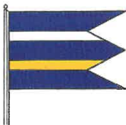
VLAJKA obce Bzovík