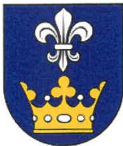
ERB obce Bzovík

Pečať Bzovíka je okrúhla, uprostred s obecným symbolom a kruhopisom OBEC BZOVÍK