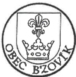
PEČAŤ obce Bzovík