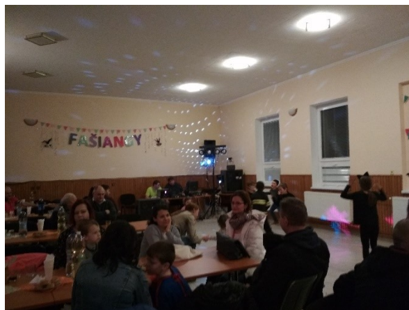
Obrázok 5 Fašiangová zábava

Spoločenský a kultúrny život v obci zabezpečuje obecný úrad v spolupráci s aktívnymi občanmi. Obecná knižnica bola v roku 2012 zlúčená so školskou knižnicou a celý knižný fond prenesený do základnej školy. V obci sa združuje ZO Jednota dôchodcov Slovenska. V obci je kultúrny dom, v ktorom sa organizujú rôzne kultúrne akcie. V roku 2019 sa konala tradičná fašiangová zábava, v októbri zas posedenie pre dôchodcov. V júli sa pri príležitosti Dňa detí cestovalo na kúpalisko do Štúrova. V decembri sa konala vysviacka adventného venca a sv. kríža, po ktorej bolo v kultúrnom dome pripravené pre