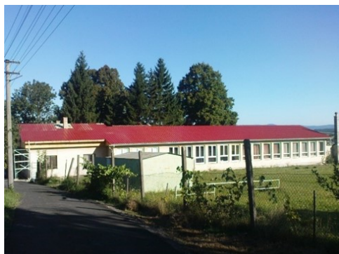
Obrázok 4 Budova ZŠ Dolný Badín