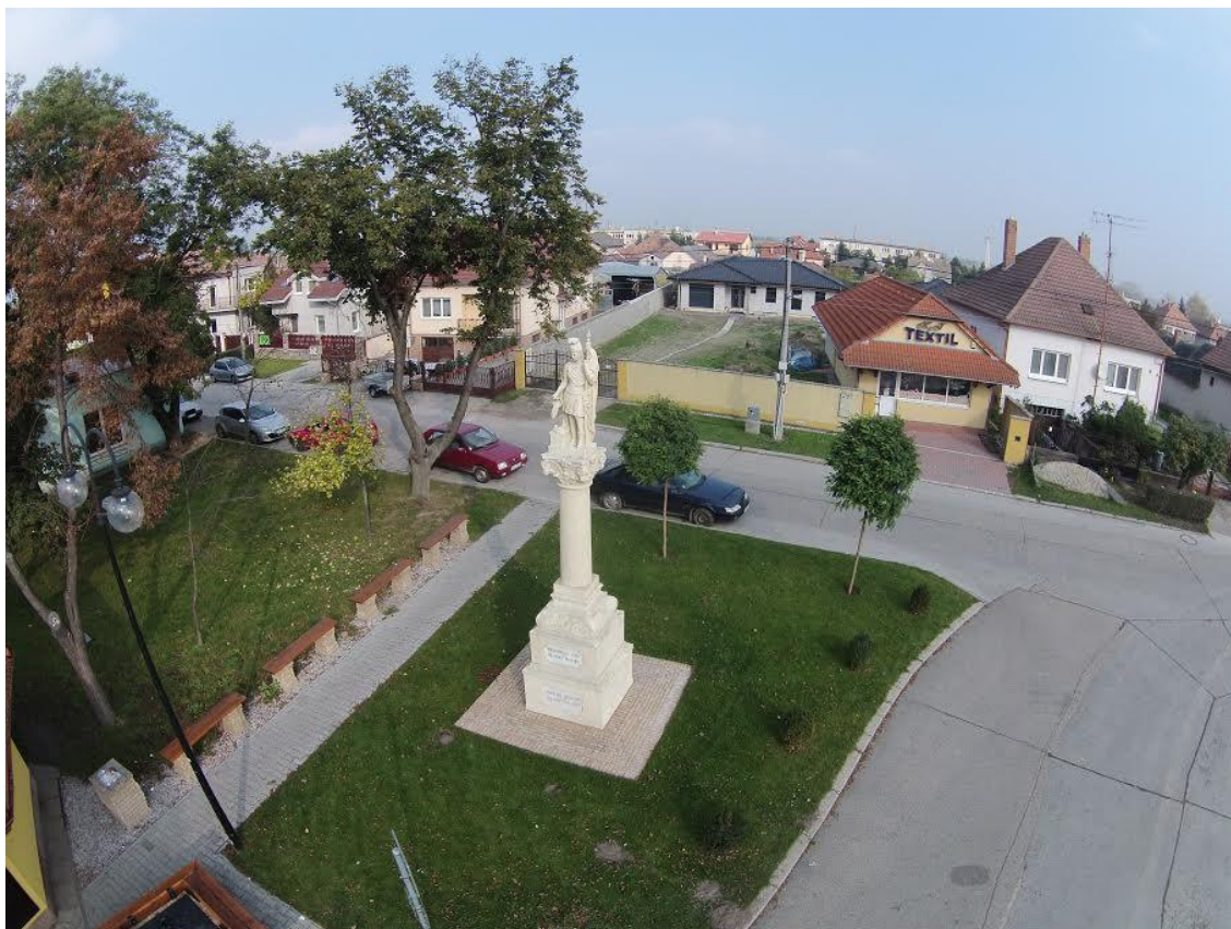
Socha Sv. Floriána