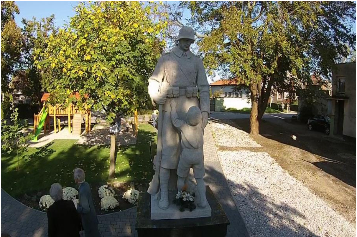
Socha – památník hrdinů I. sv. vojny