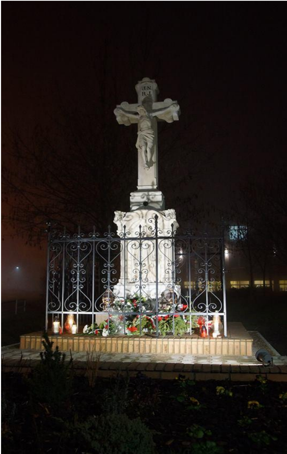
Socha Bieleho kríža