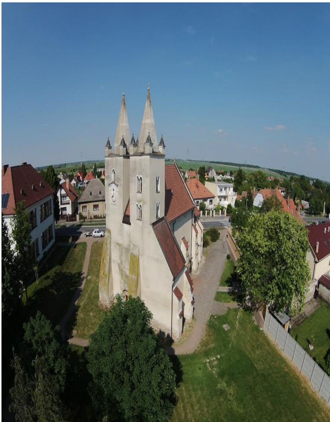
Rímsko - katolícky kostol Svätého.Jakuba – Národná kultúrna pamiatka