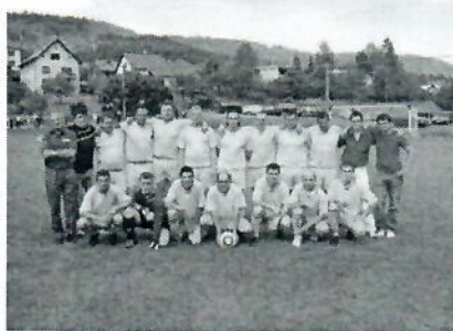
Futbalisti TJ Lodno