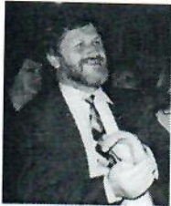
zakladateľ celoslovenskej súťažnej prehliadky rozprávačov