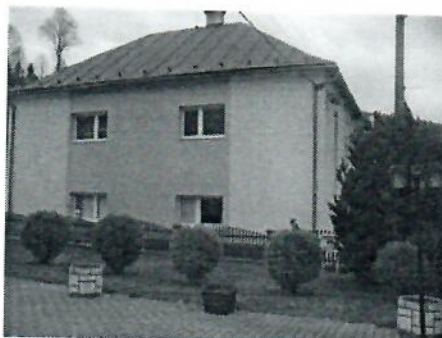
Budova obecného úradu