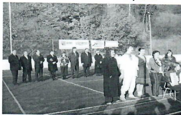
multifunkčné ihrisko pri ZŠ