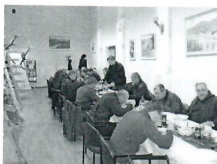
Združenie poľovníkov Kremienok