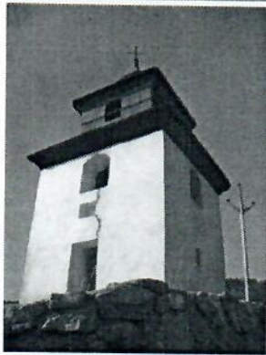
Kostol a zvonica