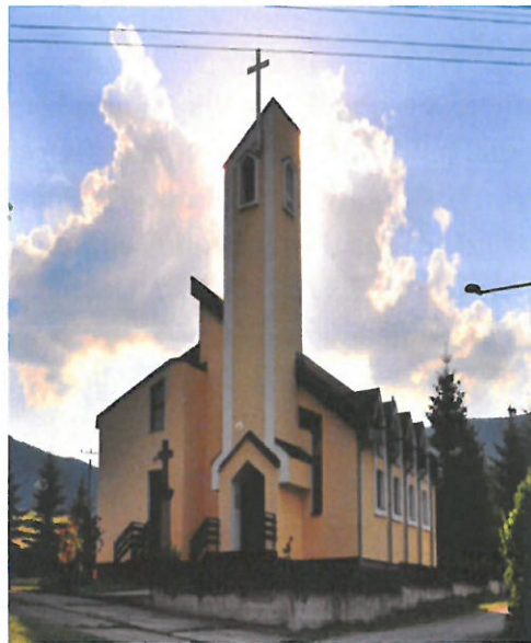
Kostol sv. Cyrila a Metoda