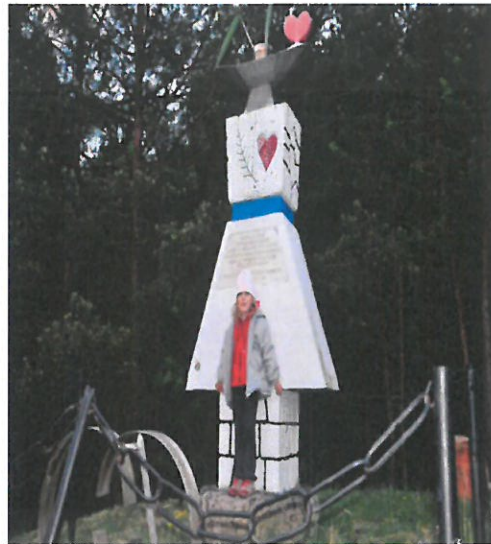
Pomník starých mládencov