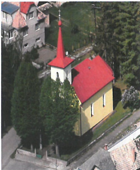
Kostol zasvätený Najsvätejšej Trojici