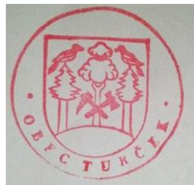
Pečať obce Turček