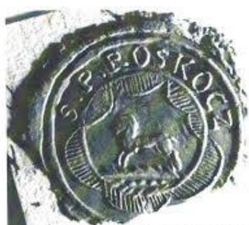
Pečať z druhej polovice 18. storočia

Obecná pečať pochádza z druhej polovice 18 storočia. Odtlačok nedatovaného typára je uložený v Uhorskom krajinskom archíve v Budapešti (MOL Budapest, V-5, Altenburger