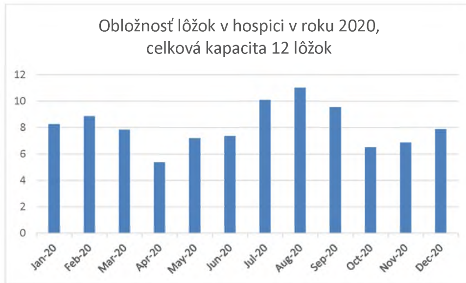
Graf 6. Obloženost' lôžok v hospici v mesiacoch január-december 2020

V roku 2020 sa nám nepodarilo naplno kapacitne využiť 12 hospicových lôžok. Obloženost' lôžok dosiahla v priemere 67,25%, vývoj v priebehu mesiacov január až december 2020 znázorňuje Graf 6. Hlavnou príčinou menšej obloženosti hospicových lôžok je skutočnosť, že VŠZP nám zazmluvnila iba 6 lôžok z celkovej kapacity 12. Finacovanie hospicovej starostlivosti samoplatcovsky je pre pacientov nedostatočný