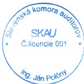
ING. JÁN POLÓNY. zodpovedný audítor Licencia UDVA č. 601