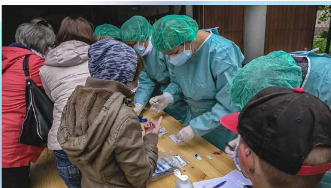
Zdravotníci Nemocnice AGEL Levice testovali Deti z centra pre deti a rodiny Levice