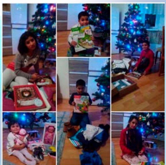
Deti z centra pre deti a rodiny Spišská Belá pri rozbaľovaní darčiekov

NADÁCIA AGEL opäť pripravila projekt „Čarovné Vianoce s NADÁCIOU AGEL“, v rámci ktorého zamestnanci zdravotníckych zariadení, aj napriek ťažkej situácii pripravili darčeky pre deti z Centier pre deti a rodiny v Nitre a Spišskej Belej a tiež pre seniorov na Oddelení dlhodobo chorých v Krupine a pre seniorov v Senior centre Sv. Kataríny v Handlovej. Pripravili sme spolu so zamestnancami a doručili adresátom viac ako 130 darčiekov.