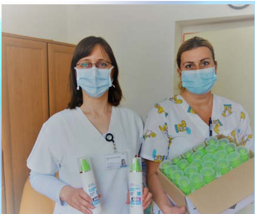
Dezinfekčné gély potešili deti i seniorov

NADÁCIA AGEL venovala dezinfekčné gély na ruky pre pacientov v zdravotníckych zariadeniach Skupiny AGEL, našou prioritou bolo byť nápomocný tu a teraz. Potešili sme tak malých pacientov a seniorov v Nemocnici AGEL Komárno a Levice na pediatrických oddeleniach a oddeleniach pre dlhodobu chorých. Deti z Centra pre deti a rodiny z Levíc sme hromadne testovali v Nemocnici AGEL Levice na ochorenie COVID-19.