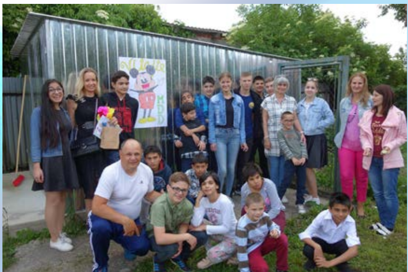
Deň detí v Centre pre deti a rodiny v Leviciach

Na Deň detí sme vycestovali za deťmi z Centier pre deti a rodiny Levice a Spišská Belá a obdarovali ich športovým náčiním, knižkami a prežili s nimi nezabudnuteľné chvíle.