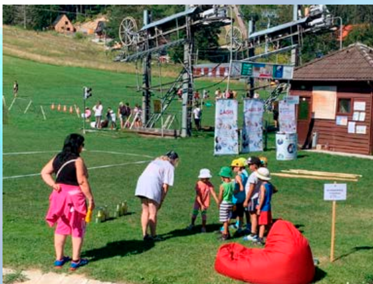
Letné športové hry pre deti z centier pre deti a rodiny

Pripravili a zorganizovali sme tretie „Letné športové hry pre deti z centier pre deti a rodiny“. Zúčastnili sa ich deti z centier Spišská Belá, Levice, Jesenské a po prvý raz sme privítali aj deti z Centra pre deti a rodiny Nitra v celkovom počte 90 detí a 15 vychovávateľov. Termín sme prispôbili aktuálnej epidemiologickej situácii a opatreniam. Deti si mohli vyskúšať rôzne športové disciplíny, deti k súťaženiu motivovali i pekné ceny, na ktoré sa tešili od začiatku dňa.