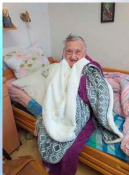
Čarovné Vianoce v Senior centre Sv. Kataríny v Handlovej