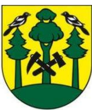
Erb obce Turček

Obec má právo na vlastné symboly. Obec, ktorá má vlastné symboly, je povinná ich používať pri výkone samosprávy. Symboly obce sú erb obce, vlajka obce, pečať obce. (zákon č. 369/1990 Zb. o obecnom zriadení)