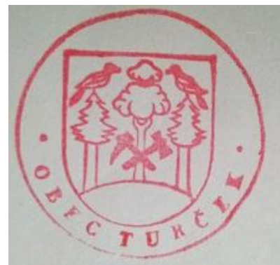
Pečať obce Turček