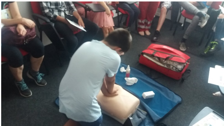
Kurz prvej pomoci