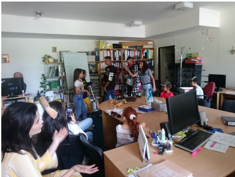
Rap a Beatbox battle