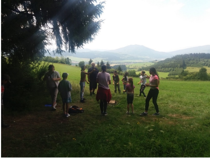
Opekačka na Trninách