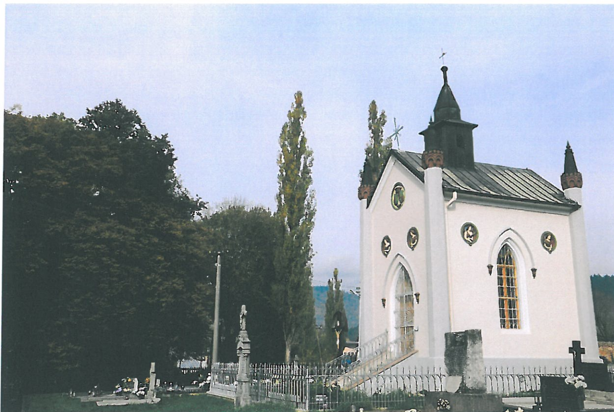
Zrekonštruovaná kaplnka na cintoríne