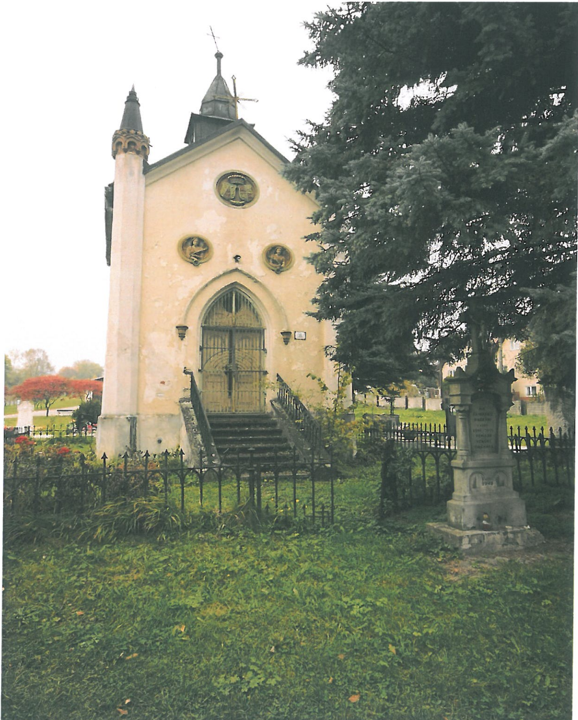
Kaplnka pred rekonštrukciou