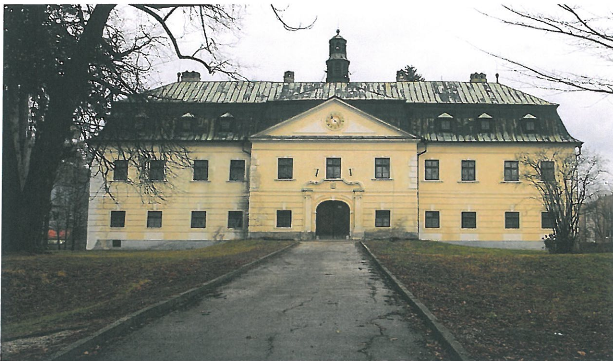
Budova pred rekonštrukciou

Sídlom Gbelianskeho panstva bol honosný barokový kaštieľ z polovice 18. storočia, ktorý stojí uprostred parku, ktorý je obohnaný kamenným múrom. Bol sídlom grófskej rodiny, istú dobu tu sídlila škola, neskôr ochranári