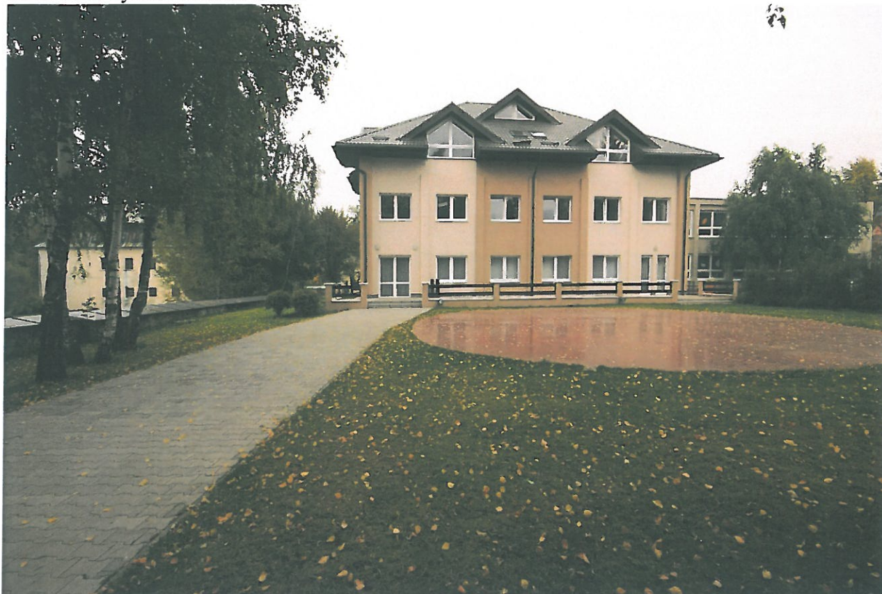
Budova kultúrneho domu po rekonštrukcii

V roku 2011 bola dokončená prestavba Kultúrneho domu, čím sa zvýšila možnosť väčšieho kultúrneho využitia občanov obce.