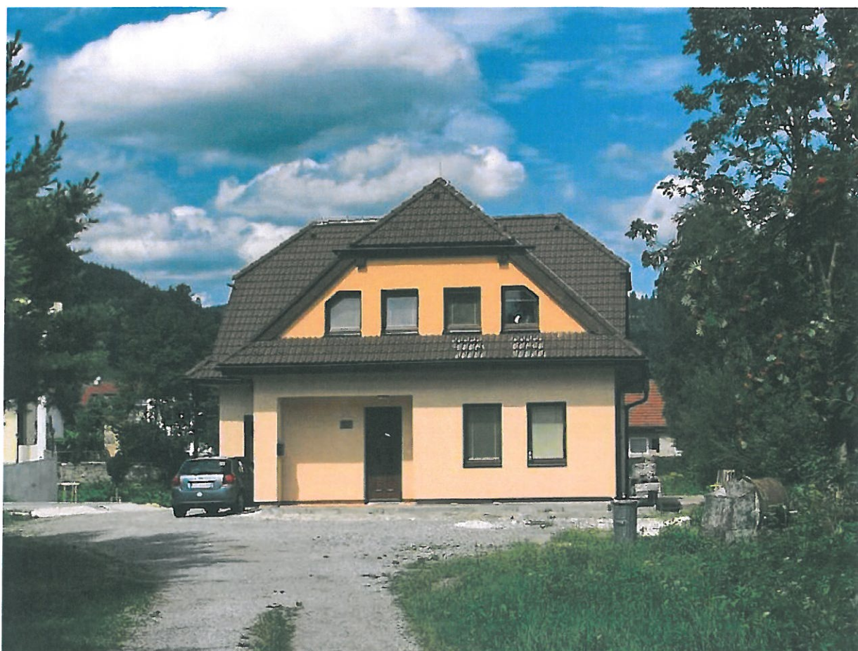
Farský úrad Gbel'any