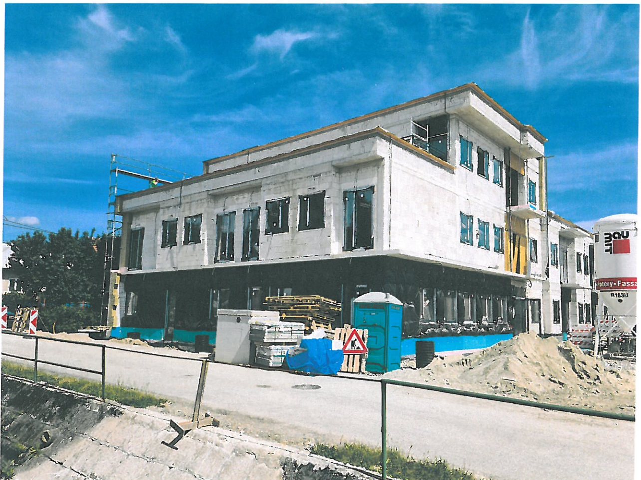
Stavba DSS Gbeľany