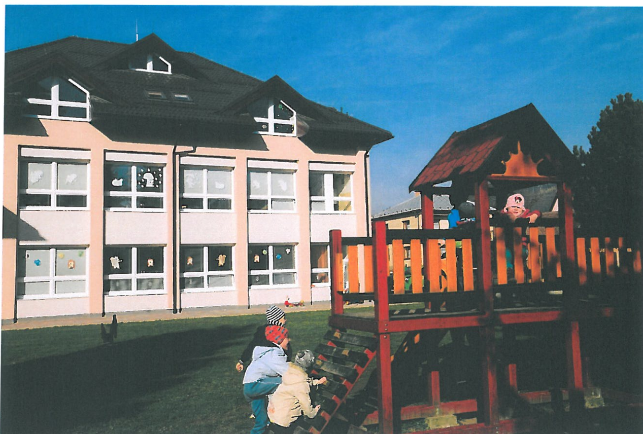
Budova MŠ po rekonštrukcii

Od 1.1. 2015 je prevádzka MŠ v novo zrekonštruovanej a nadstavenej budove. Pribudli nové priestory, v podkroví telocvičňa a stabilná spáľňa so sociálnym zariadením.