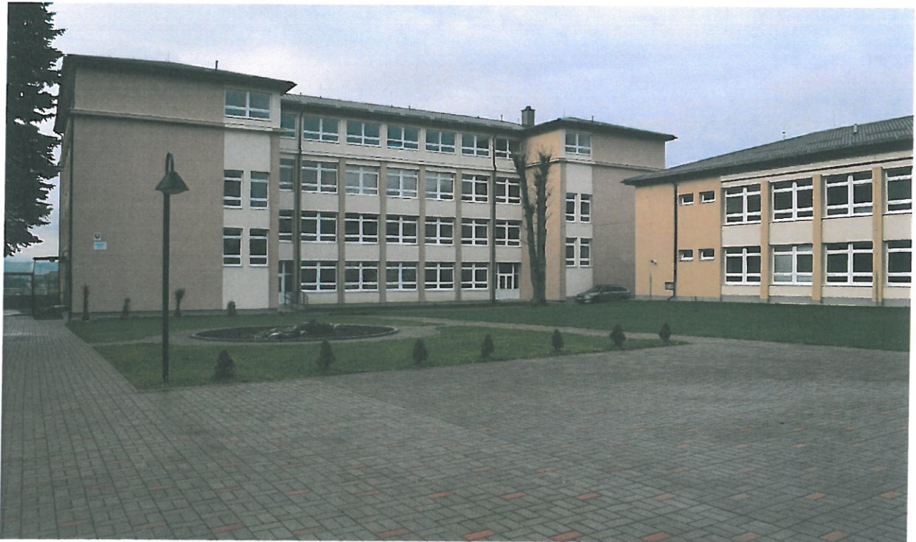
Budova ZŠ po rekonštrukcii