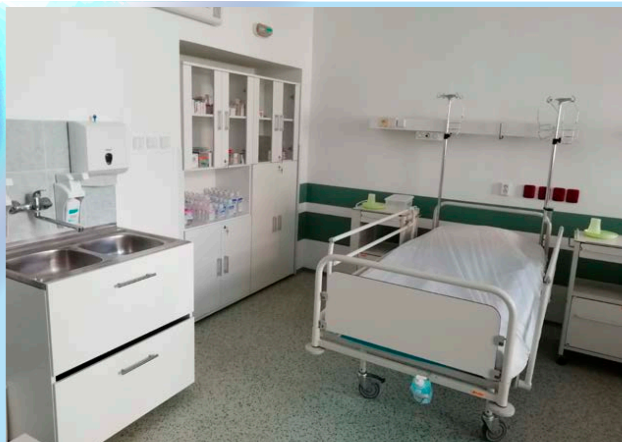
Priestory zrekonštruovaného JIS odd. vnútorného lekárstva