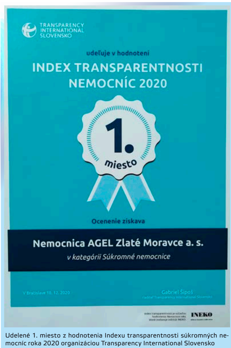
Udelené 1. miesto z hodnotenia Indexu transparentnosti súkromných nemocníc roka 2020 organizáciou Transparency International Slovensko

Na záver môjho úvodného slova, mi Vážené dámy, Vážení páni, dovoľte poďakovať sa všetkým zamestnancom Nemocnice AGEL Zlaté Moravce a.s. za ich obetavú prácu a pracovné úsilie, ktoré vynakladali pri všetkých činnostiach pri realizácii cieľov našej spoločnosti. Poďakovanie tiež patrí vedeniu spoločnosti, členom Predstavenstva a Dozornej rady ako aj všetkým partnerským inštitúciám, ktoré sa podieľali na rozvoji spoločnosti v uplynulom roku.