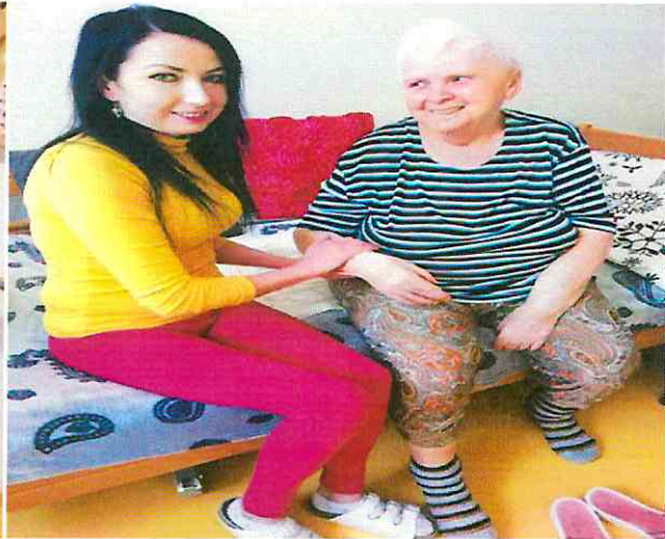
Kľúčový pracovník prijímateľky

Prechádzky a posedenia v prírode a na terase – umožnenie prechádzok alebo posedení prijímateľom, ktorí sa z dôvodu svojej zníženej pohyblivosti alebo zníženej orientačnej schopnosti nemôžu pohybovať sami. Posedenia sú doplnené o tematický a relaxačný rozhovor, hranie slovných hier, spievanie ľudových piesní a pod. Realizujú sa individuálne alebo v malých skupinkách za pekného počasia.