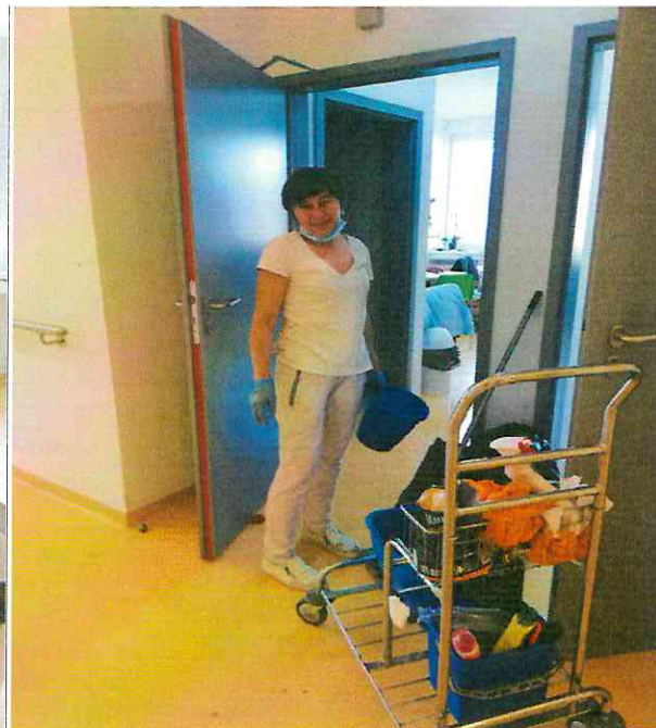
Dezinfekcia a čistota v zariadení

Hygienický režim sú zásady a pracovné postupy pre dodržiavanie všeobecných hygienických požiadaviek, pri ktorých preventívnym spôsobom znižujeme a vylučujeme nesprávne pracovné postupy. Dôležitým opatrením prevencie je zabránenie prenosu nákazy od prameňa nákazy k zdravému jedincovi, ktorým je dezinfekcia. Týmto opatrením zabráňujeme šíreniu patogénnych mikroorganizmov. Výkon dezinfekčných prác vykonávame prostredníctvom vlastných zamestnancov. Dôležitou podmienkou úspešnej dezinfekcie je mechanická očista, ktorá zabezpečí dôkladné odstránenie znečisťujúcich látok a mechanických nečistôt zo zariadení a plôch. Využívame chemickú dezinfekciu /pôsobenie