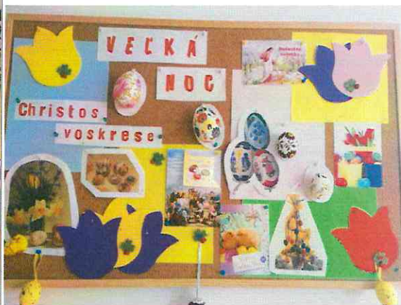
Výroba veľkonočných kraslíc