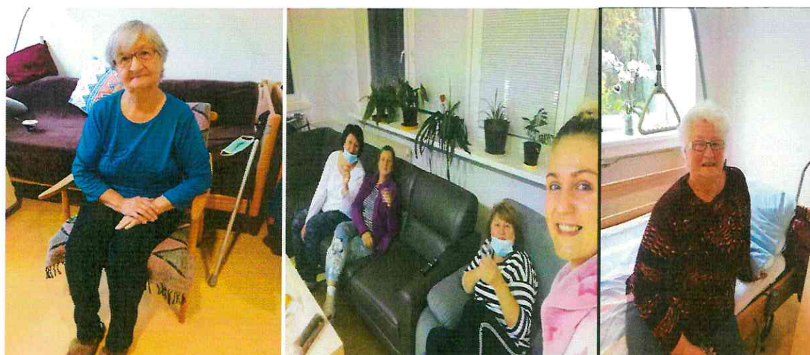
Všetci spolu v karanténe 22 dní. V zariadení pre seniorov sme ťažké Covidové stavy nemali.

Vzhľadom na výskyt infekčného ochorenia COVID-19 sa museli prijať nové opatrenia a zmeniť režim ošetrovateľsko-opatrovateľskej starostlivosti. Bolo potrebné pristúpiť k vypracovaniu dokumentov: Preventívny postup, Krízový plán, Krízová komunikácia,