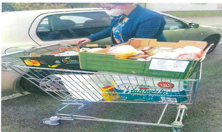
Zabezpečovanie nákupov pre obyvateľov zariadenia

Počas vydaného zákazu návštev (s výnimkou prijímateľa v terminálnej fáze života, z hľadiska etických princípov a za prísnych protiepidemiologických opatrení) komunikácia obyvateľov s rodinnými príslušníkmi a inými blízkymi osobami prebiehala predovšetkým telefonicky alebo online, využívajúc sociálne siete, dostupné komunikačné platformy alebo dostupné mobilné aplikácie. Stretnutia obyvateľov s príbuznými a inými blízkymi osobami sa realizovali v súlade s aktuálnymi podmienkami a opatreniami danými vyhláškou Úradu verejného zdravotníctva SR, s pandemickým plánom a semaforom pre poskytovateľov sociálnej služby a v súlade s krízovým plánom zariadenia. Tieto stretnutia boli realizované podľa vopred dohodnutého harmonogramu. Ktorý sa priebežne doplňal a aktualizoval.