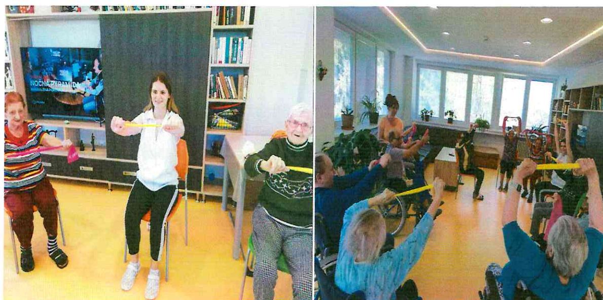
Skupinové cvičenia pod odborným vedením fyzioterapeutky

Skupinové cvičenie zahŕňa vyhotovenie cvičebnej jednotky s dôrazom na držanie tela a zvýšenie mobility. Priebeh cvičenia: rozvíčka, cvičenie, relaxácia.