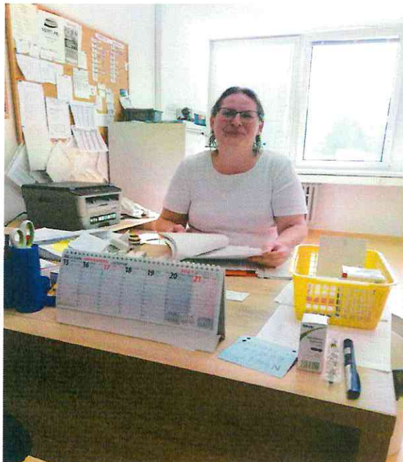
Hlavná zdravotná sestra

Komplexná ošetrovateľská starostlivosť je zabezpečená nepretržite 24 hodín kvalifikovanými sestrami a je zameraná na prevenciu, upevňovanie, prinavrátenie a zlepšenie zdravia v súlade so sociálnym prostredím. Hlavný dôraz sa kladie na uspokojovanie bio-psycho-sociálnych potrieb u obyvateľa. Ošetrovateľská starostlivosť je poskytovaná v súlade s novými poznatkami a postupmi v ošetrovateľstve formou ošetrovateľského procesu. Súčasťou ošetrovateľského procesu je dôkladné vedenie ošetrovateľskej dokumentácie, záznamy sa budú robiť v informačnom systéme Cygnus. Sestra vypracováva celkovú anamnézu od nástupu prijímateľa do zariadenia a zapisuje do karty prijímateľa. Po zaškolení v programe CYGNUS, každú zmenu zdravotného stavu zapiše do dokumentácie v programe.