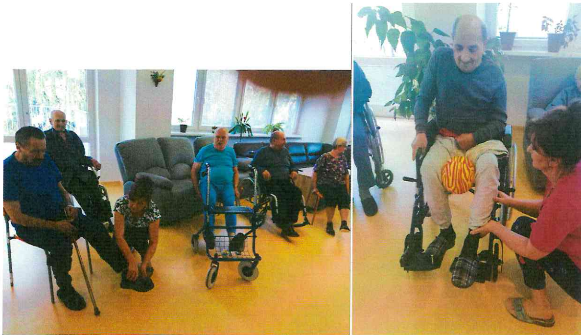
Pomoc pri cvičení s prijímateľmi

Individuálne plánovanie s programom sociálnej rehabilitácie – proces individuálneho plánovania prebieha za aktívnej účasti prijímateľa s prihliadnutím na jeho schopnosti a možnosti s cieľom naplniť jeho individuálne potreby, želania a osobné ciele. Proces individuálneho plánovania prebieha v interdisciplinárnom tíme odborných pracovníkov a opiera sa o komplexné posúdenie sociálneho a zdravotného stavu každého prijímateľa. Proces zahŕňa identifikáciu individuálnych potrieb, voľbu cieľov, voľbu metód, stanovenie programu sociálnej rehabilitácie a plánu činností, hodnotenie. Sociálna rehabilitácia je súčasťou individuálneho plánovania z dôvodu potreby dosahovať individuálne ciele prostredníctvom využívania metód a techník z rôznych druhov terapií a denných činností obyvateľa ako nástroj na dosiahnutie týchto cieľov.