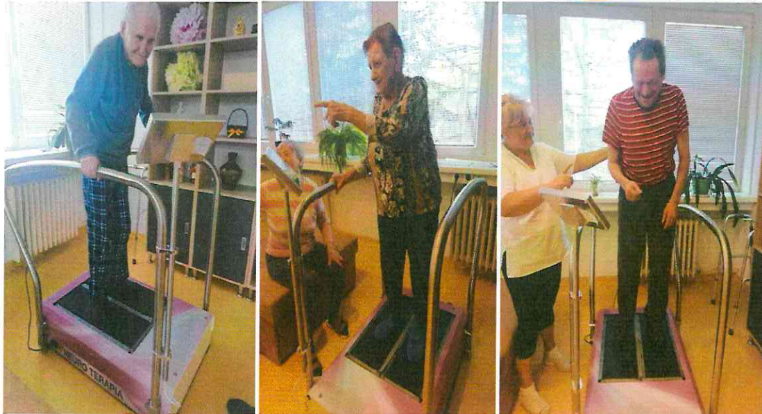
Zeptoring si prijímatelia veľmi pochvaľujú

V zariadení pre seniorov sa snažíme pri poskytovaní sociálnej služby rešpektovať potreby prijímateľa, úplne rešpektovať dôstojnosť a jeho slobodné rozhodovanie, podporovať prijímateľa v udržaní čo najvyššej kvality života aj napriek fyzickým a psychickým obmedzeniam, zachovať čo najdlhšie ich sebestačnosť, udržiavať kontakt a väzby s rodinou, primerane ich aktivizovať k účasti na aktivitách. Snažíme sa dopĺňať neustále nové aktivity, ktoré našich prijímateľov obohatia o nové skúsenosti a zážitky.