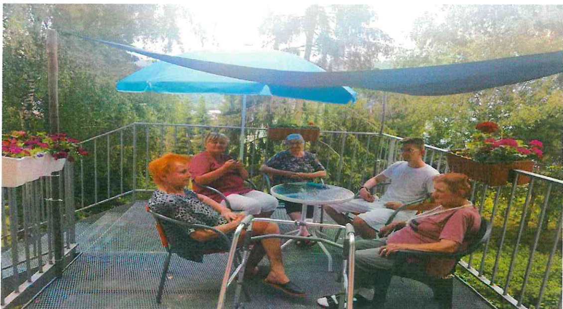
Relaxačná terasa pre prijímateľov

Prechádzky a posedenia v prírode a na terase – umožnenie prechádzok alebo posedení prijímateľom, ktorí sa z dôvodu svojej zníženej pohyblivosti alebo zníženej orientačnej schopnosti nemôžu pohybovať sami. Posedenia sú doplnené o tematický a relaxačný rozhovor, hranie slovných hier, spievanie ľudových piesní a pod. Realizujú sa individuálne alebo v malých skupinkách za pekného počasia.