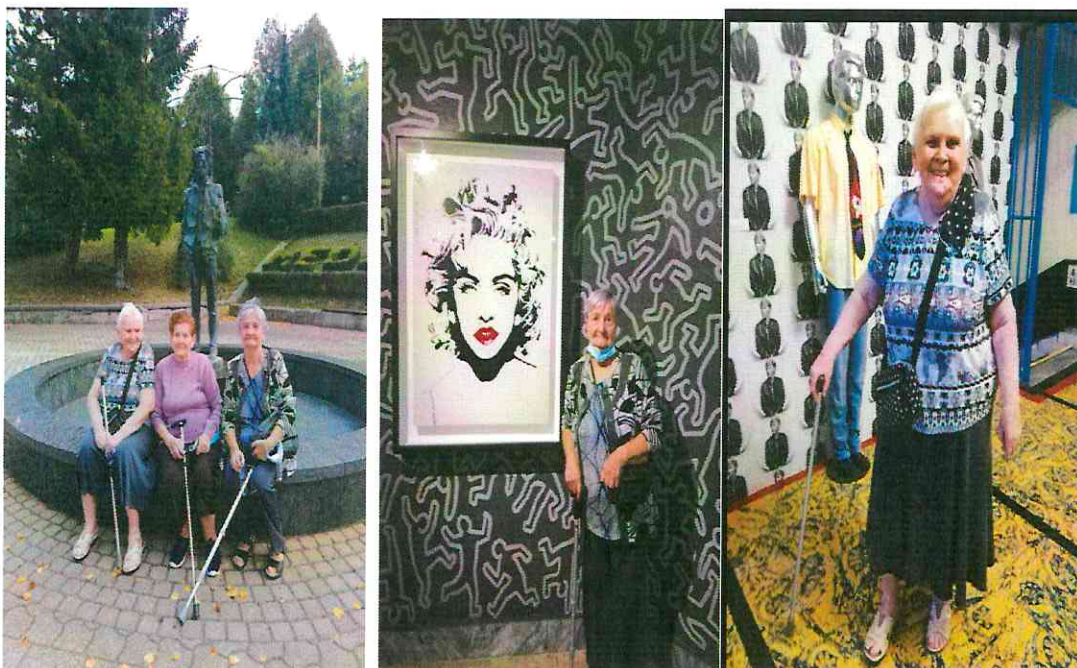
V múzeu Andyho Warhola

V priebehu roka sme navštívili múzeum Andyho Warhola v Medzilaborciach, za prísnych hygienických podmienok. V tom období sa zlepšil pandemický stav na Slovensku a prijímatelia si želali sprievod do múzea. Vedenie múzea nám vyhovelo, kedy nám sprístupnil priestory na obhliadku vo vyhradený čas pre našich prijímateľov.