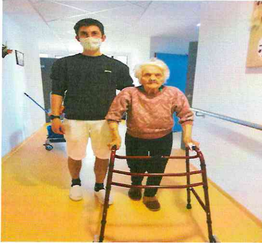
Podpora pri chôdzi

Podpora a nácvik orientácie a mobility – kompenzuje sa znížená pohybová alebo orientačná schopnosť prijímateľa, realizuje sa v zariadení alebo mimo neho. Účelom je zmierniť alebo prekonať znevýhodnenie v prístupe k veciam osobnej potreby a uľahčenie orientácie a premiestňovania sa.