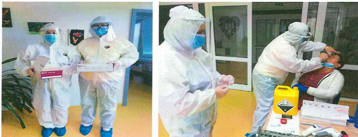
Testovanie prijímateľov a zamestnancov zariadenia

Komplexná ošetrovateľská starostlivosť bola zabezpečená nepretržite 24 hodín kvalifikovanými sestrami a bola zameraná na prevenciu, upevňovanie, prinavrátenie a zlepšenie zdravia v súlade so sociálnym prostredím. Hlavný dôraz sa kládol na uspokojovanie bio-psycho-sociálnych potrieb u obyvateľov. Ošetrovateľská starostlivosť bola poskytovaná v súlade s novými poznatkami a postupmi v ošetrovateľstve formou ošetrovateľského procesu. Súčasťou ošetrovateľského procesu bolo dôkladné vedenie ošetrovateľskej dokumentácie, záznamy sa robia v informačnom systéme Cygnus. Sestra vypracovávala celkovú anamnézu od nástupu obyvateľa do zariadenia a každú zmenu zdravotného stavu zapisovali do dokumentácie v programe Cygnus.