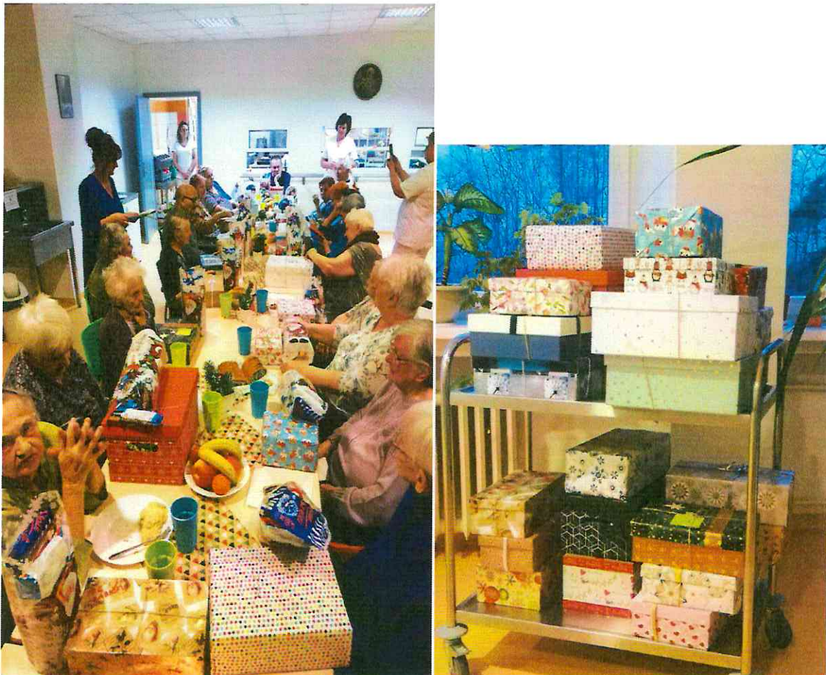
Spoločná štedrá večera v zariadení. Zapojili sme sa do projektu: Koľko lásky sa zmestí do krabice od topánok.

Prostredníctvom tímu kvalifikovaného personálu a v zmysle zákona č. 448/2008 Z. z. o sociálnych službách v znení neskorších predpisoch systematicky plánujeme a zabezpečujeme poskytovanie sociálnych služieb s cieľom vytvárať podmienky na dôstojný a plnohodnotný život pre našich prijímateľov. Pri kontakte s obyvateľmi uplatňujeme profesionálny a holistický prístup, ktorý vychádza z ich biologických, psychologických, sociálnych a spirituálnych či kultúrnych potrieb.