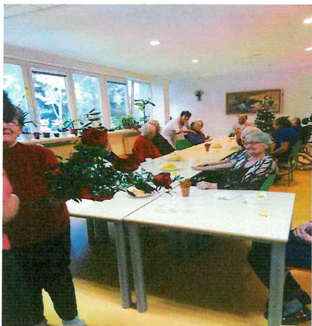
Oslava narodenín v zariadení

Súčasťou starostlivosti o našich prijímateľov je kultúrna a záujmová činnosť. V období pandémie bolo sťažené realizovať tieto podujatia, ale snažili sme sa zmysluplne, s ohľadom na vek, zdravotné postihnutie, potreby a záujmy obyvateľov napĺňať a organizovať v rámci zariadenia pre seniorov.