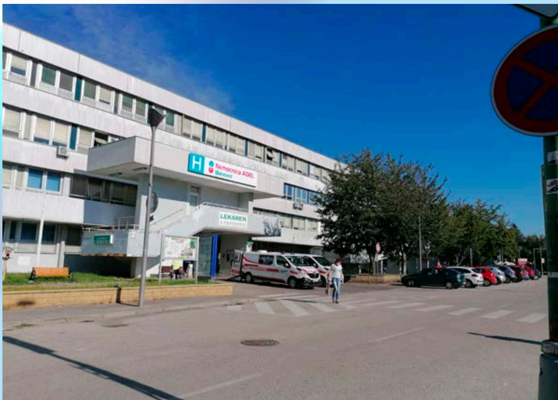
Nemocnica AGEL Bánovce s.r.o.