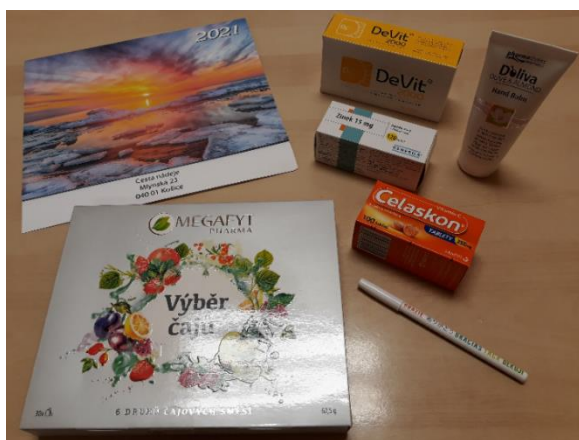
Obr. 4 Vianočný balíček pre zamestnancov

Všetkým zamestnancom sme ku koncu roka pripravili Vianočné balíčky (Obr. 4).