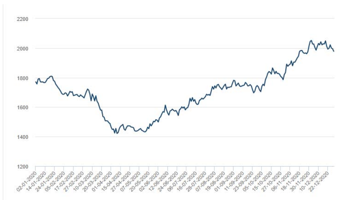
Vývoj cien hliníka na Londýnskej burze (LME) USD/t