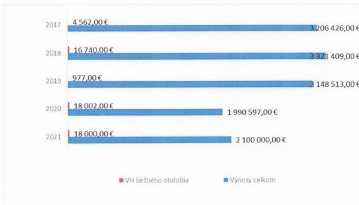
graf č. 1