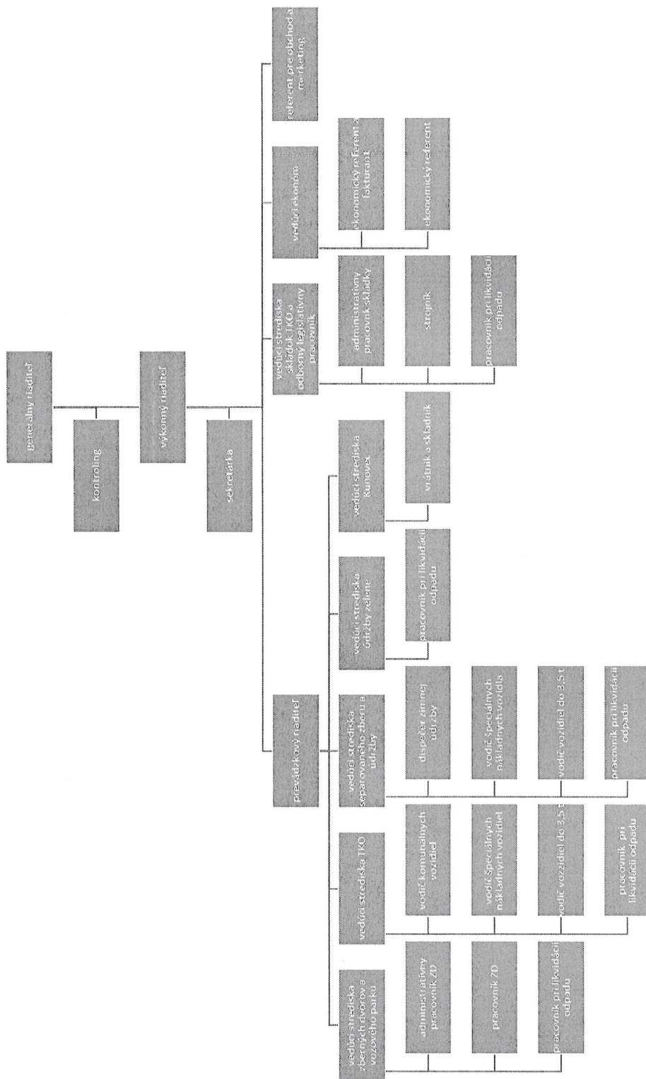
Obrázok 1 Organizačná štruktúra spoločnosti