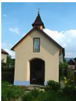
Kaplňka u Matuška