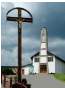
Kostol sv. Cyrila a Metoda v Rakovej – Korcháni z roku 1991