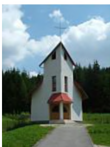
Kaplňka v miestnej časti u Blažička z roku 2002