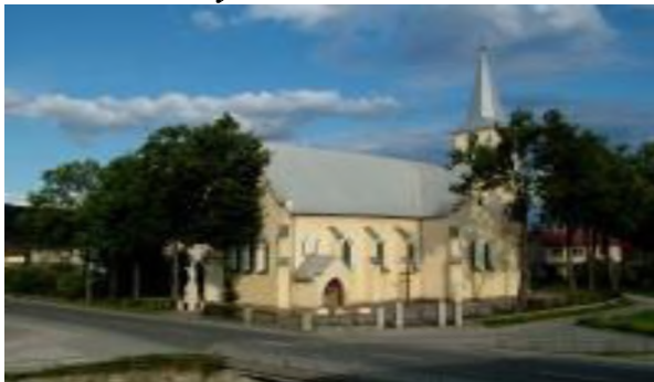
Rímsko-katolícky kostol Narodenia Panny Márie z roku 1874