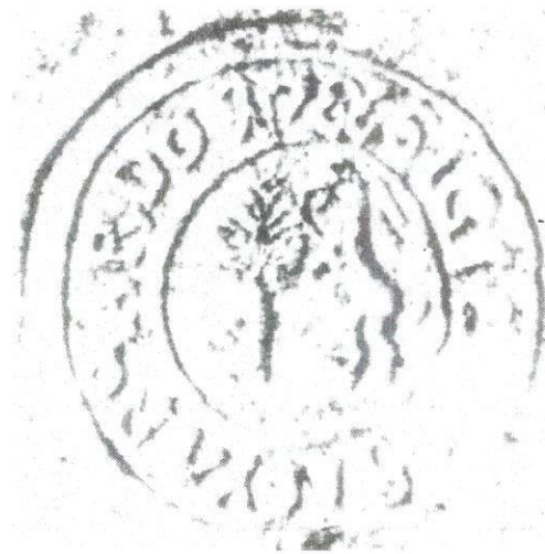
Pečat z roku 1786