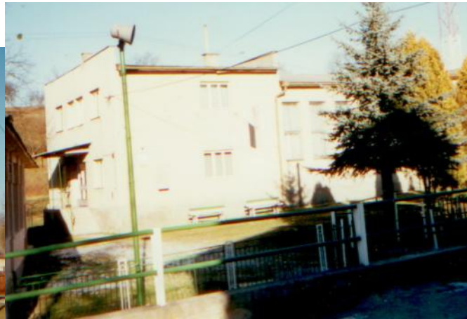
Budova požiarnej zbrojnice bola postavená v r. 1953 Budova Obecného úradu a Kultúrneho domu v Kocelovciach skolaudovaná v auguste 1974 a rekonštruovaná v roku 1978