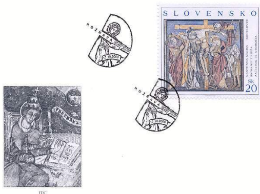
Známka obce: Nástenná maľba Kocel'ovce, Snímanie z križa