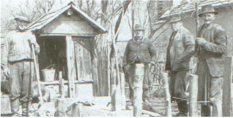
Muži z Kocel'oviec v pracovnom oblečení