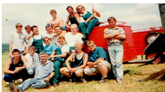
Dobrovoľný hasičský zbor z roku 2002