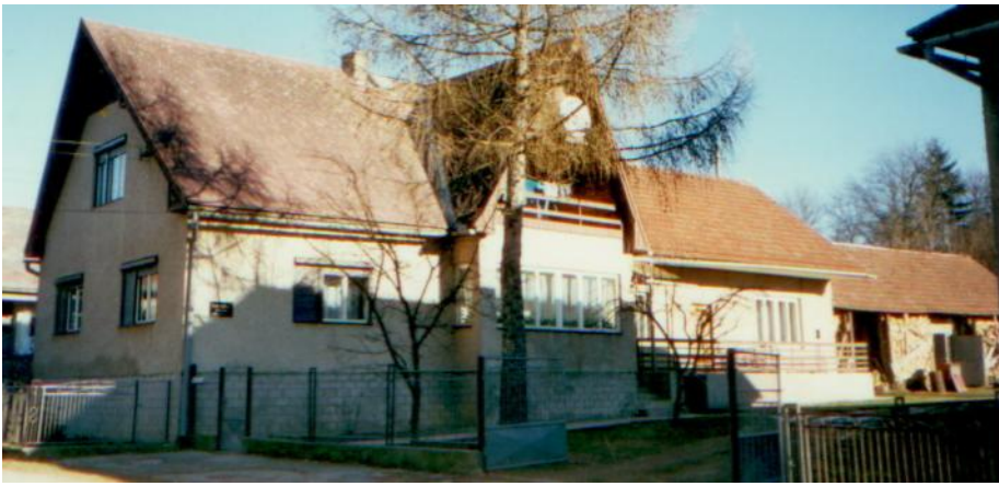
Budova novej fary