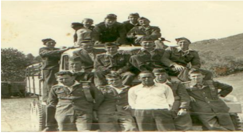
Dobrovoľný hasičský zbor z roku 1959