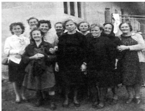
Táto fotografia vznikla pravdepodobne v 50 rokoch 20. storočia a vidíme na nej návštevu amerických migrantov v rodnej obci Kocel'ovce.