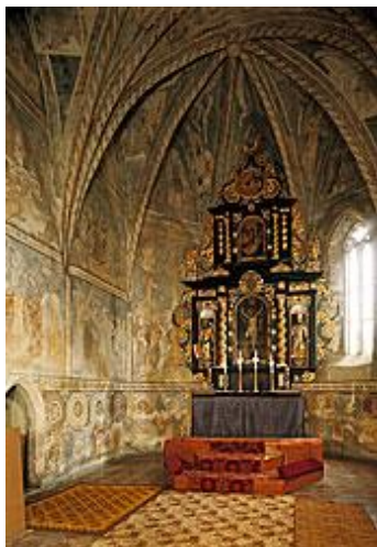
Barokový oltár pochádza z roku 1740