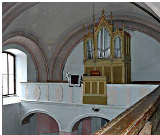
Organ z roku 1908