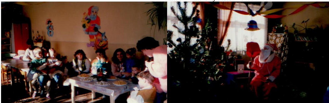
Mikuláš v Materskej škole v rokoch 1999

Obec poskytovala výchovu a vzdelávanie detí: