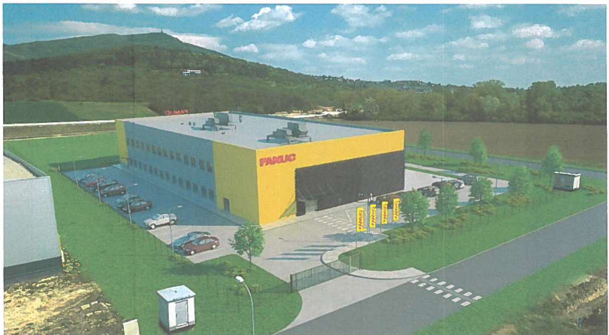
Vizualizácia budúceho areálu FANUC Slovakia

V súčasnosti sídli FANUC Slovakia v prenajatých priestoroch, ktoré na plánovaný rast spoločnosti v budúcnosti nebudú stačiť. Preto bolo rozhodnuté, že bude postavené nové, vlastné sídlo spoločnosti. Na financovanie stavby sú použité vlastné prostriedky skupiny FANUC – materskej spoločnosti FANUC Europe Corporation. V apríli 2021 bol pre tento účel príspevkom jediného spoločníka vytvorený kapitálový fond vo výške 3 700 000 eur. Peňažné prostriedky sú používané na priebežné financovanie vybudovania nového areálu spoločnosti FANUC Slovakia. Plánovaný dátum ukončenia stavby je december 2021.