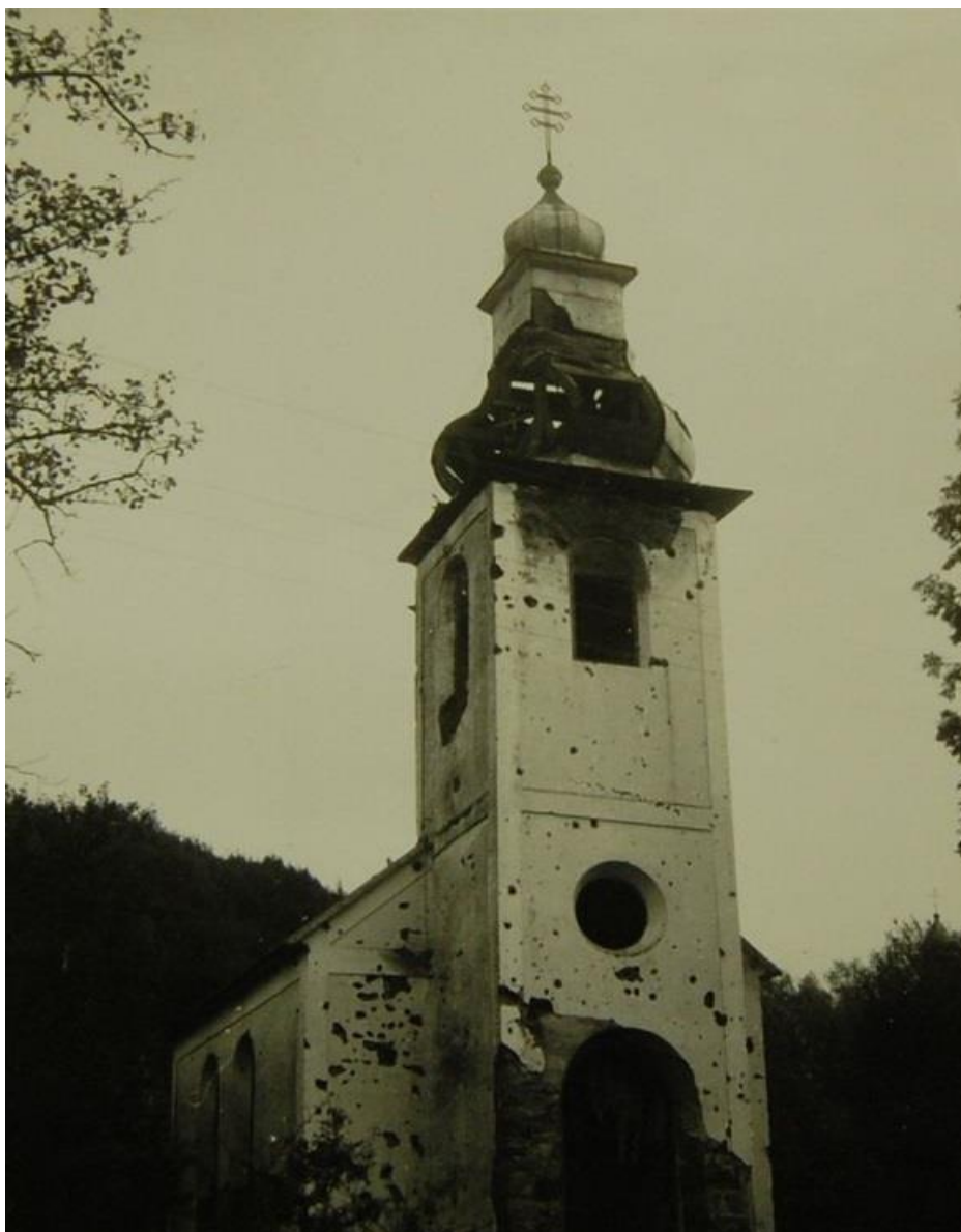
Obr. č.1: Vojnou zničený gréckokatolícky chrám sv. veľkomyčovníka Dimitrija Solúnskeho

Svoje stopy na obyvateľoch a obci zanechala aj 2. svetová vojna, ktorá opäť priniesla biedu a utrpenie nevinných ľudí. To sa skončilo až 12.10.1944, kedy bola obec oslobodená. Pri oslobodení obce položilo svoj život 121 ruských vojakov. Počet padlých nemeckých vojakov nie je známy, pretože podľa obecnej kroniky nemecká armáda mŕtvych a ranených vojakov brala so sebou. Na pamiatku oslobodenia sa v obci na starej budove pošty nachádza pamätná tabuľa na počesť padlých vojakov, ktorí položili svoj život pri oslobodení obce. Na nasledujúcej fotografii je vidieť poškodenie gréckokatolíckeho chrámu sv. veľkomyčovníka Dimitrija Solúnskeho, spôsobené počas vojny.