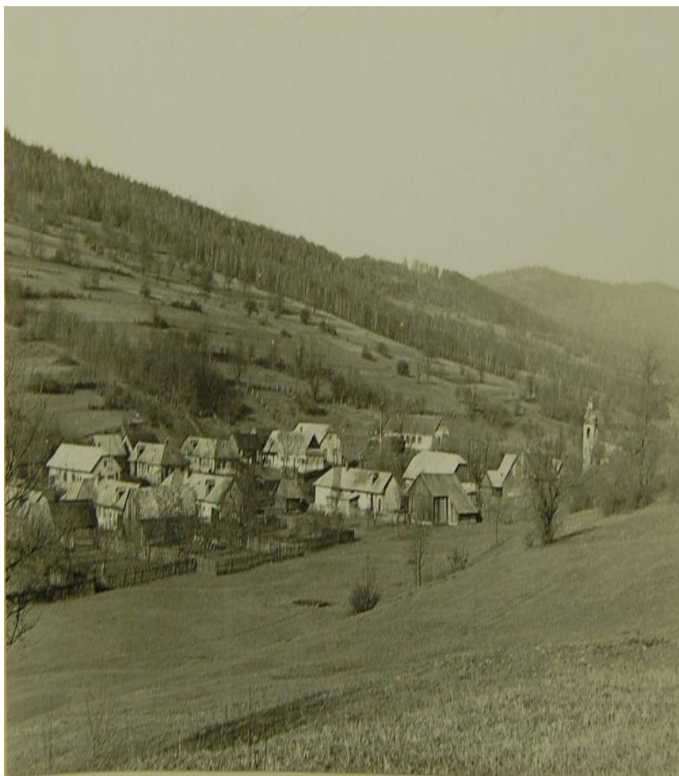
Obr. č.2: Obec v období 50-tych rokov

V povojnovom období začala vojnami spustošená obec získavať svoju novú tvár. V roku 1945 začal štát budovať asfaltovú cestu z Hunkoviec cez Korejovce, Medvedie až do Krajnej Porúbky a Šarbova. Pri výstavbe cesty s radosťou pomáhali aj občania obce Medvedie, lebo vedeli, že cesta bude slúžiť im. Kto mal koňa a voz, vozil materiál, kto nie, pomáhal sám. Výstavba cesty bola dokončená v roku 1947. V roku 1948 začal štát realizovať výstavbu nových domov pre obyvateľov, ktorým domy počas 2. svetovej vojny zhoreli alebo boli zničené. V roku 1950 bolo dokončených 12 domov, do ktorých ľudia prichádzali s radosťou a slzami z pivníc a zemlianok. V týchto domoch prijali aj občanov, ktorí nové domy nemali. Na nasledujúcej fotografii z obdobia 50-tych rokov je vidieť niektoré z novopostavených domov.