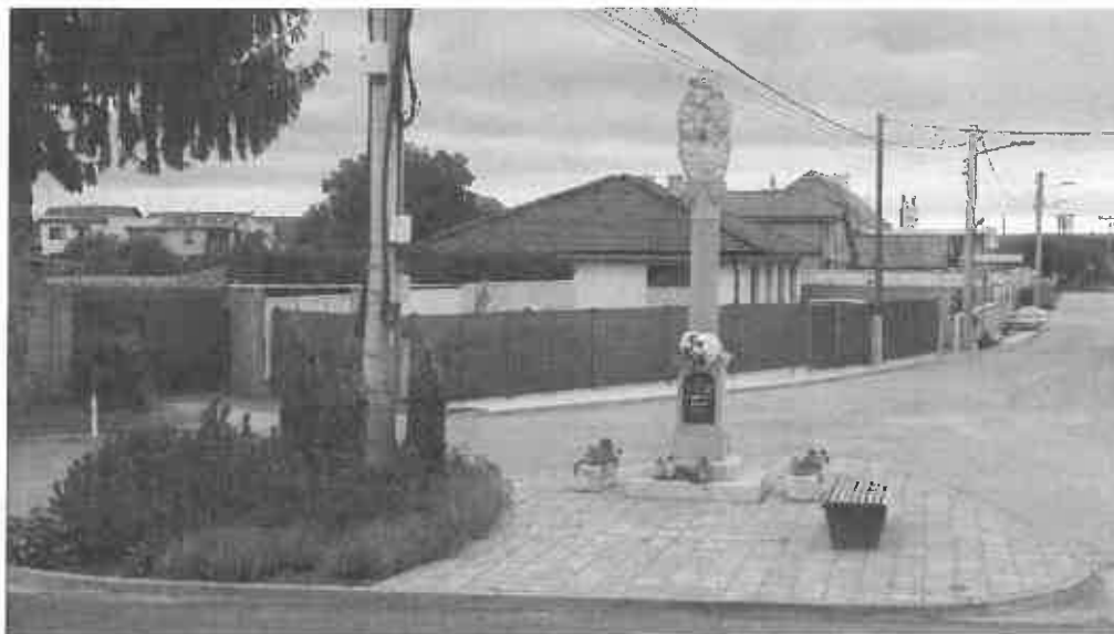
socha Najsvätejšej Trojice postavená v roku 1923 Ruženským spolkom