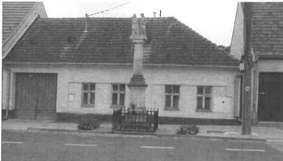
Ďalšie sochy sú z dvadsiatych rokov 20. storočia. Je to socha sv. Cyrila a sv. Metoda z roku 1924 ktorú dal postaviť Spolok sv. Vojtecha