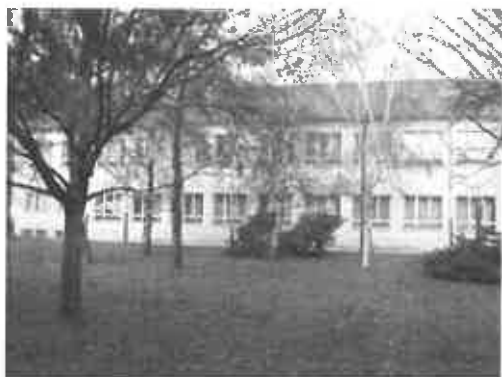
Základná škola História školy