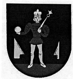
Znak obce Močidl'any

Močidl'any sa roku 1392 spomínajú od menom MOCHILAN. Patrili rovnako ako Popudiny k panstvu Holíč a v rokoch 1730 – 1773 Skalickým jezuitom a potom Habsburgovcom. V 18. storočí sa obec nazývala CZOBORFALVA. Roku 1715 mala obec desať poddanských a trinásť želiarskych domácností, roku 1828 64 domov a 520 obyvateľov. Znak obce Močidl'any je tvorený modrým štítom, kde sa na zelenej pažiti nachádza strieborná postava sv. Štefana v červenom kabátcí, v strieborných nohaviciach a zlatých topánkach, so zlatou korunou na hlave a zlatým jablkom a žezlom v rukách. Po stranách strieborný lemeš a čerieslo. Tento znak pochádza z pečatidla z roku 1777.