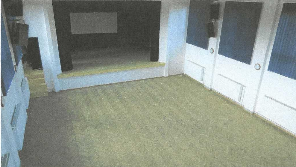
Rekonštruovaná sála kultúrneho domu

Vzhľadom na pandemické opatrenia COVID-19 od marca 2020 činnosť obecného úradu v styku s verejnosťou, ako aj činnosť týchto organizácií bola výrazne obmedzená. Všetky plánované kultúrne a športové akcie boli kvôli opatreniam zrušené. Bol aktivovaný Krízový štáb obce, ktorý postupne zapracovával pokyny Okresného Krízového štábu do podmienok našej obce. Informácie boli sprostredkované obecným rozhlasom, na webovej stránke a vo vývesnej tabuli.