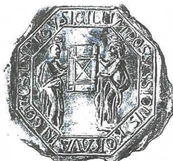
Pečať zo začiatku 18. storočia