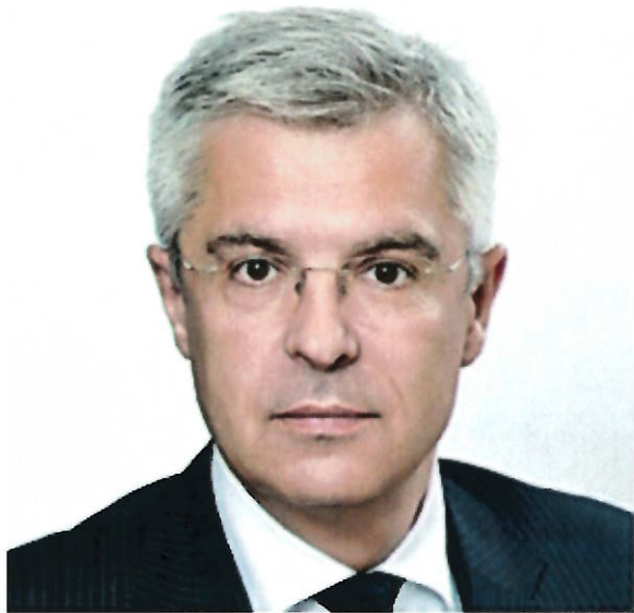
Ivan Korčok minister zahraničných vecí a európskych záležitostí Slovenskej republiky