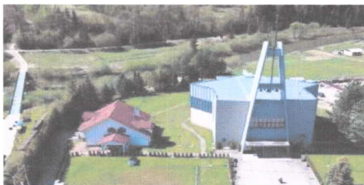
Konsolidovaná výročná správa obce Zborov nad Bystricou za rok 2020