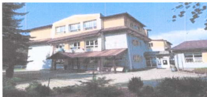
Konsolidovaná výročná správa obce Zborov nad Bystricou za rok 2020