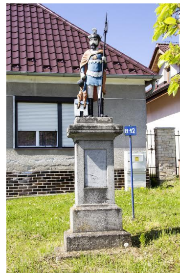
Socha svätého Floriána