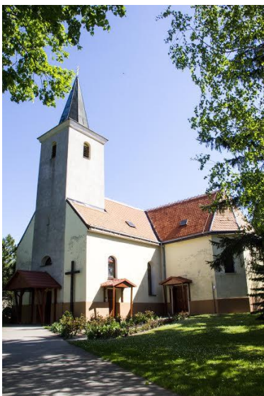
Rímskokatolícky kostol svätej Anny