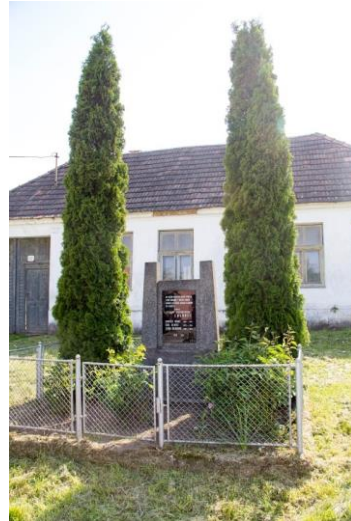
Pomník padlým v II. svetovej vojne