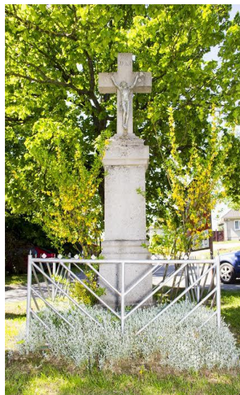
Kristus na križi