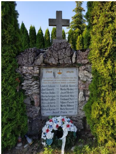
Pomník padlým v I. svetovej vojne