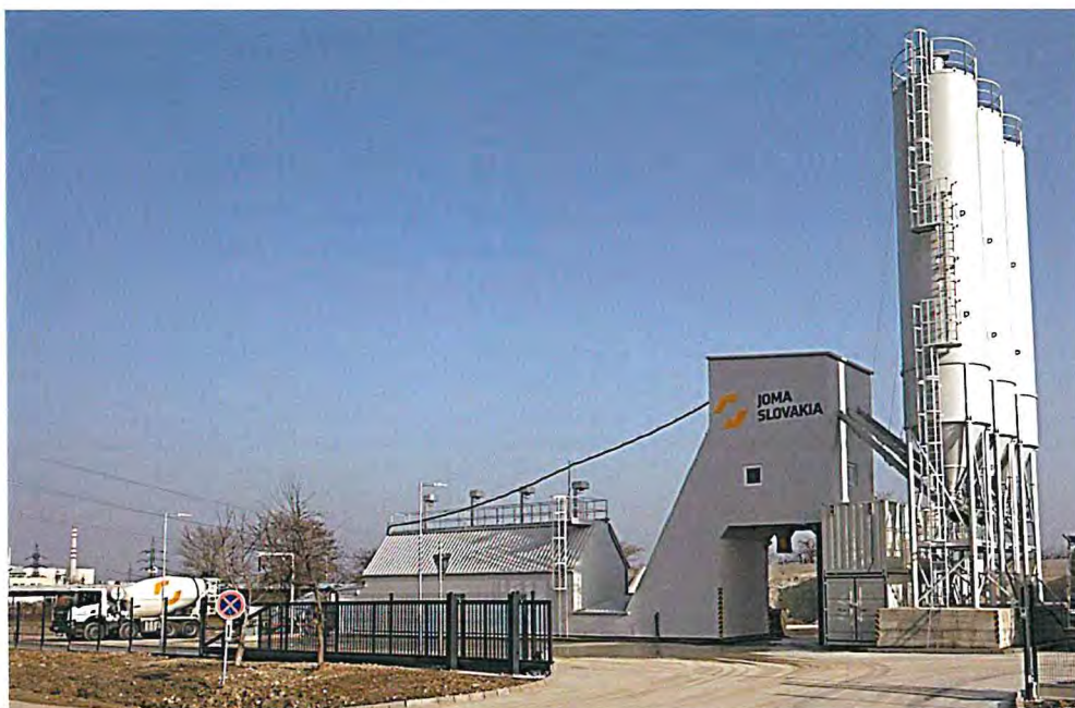
Obrázok 1 Aktuálny náhľad betonárky

Dopravu a čerpanie betónu považujeme za kľúčovú časť nášho výrobného - dodávateľského procesu. Na dopravu používame autodomiešavače s objemom až 9 m 3 betónovej zmesi. Čerpanie betónu zabezpečujeme čerpadlami s dosahom až 48 m. Základnými kameňmi našej filozofie pri výrobe betónu sú kvalita, odbornosť a spoľahlivosť.