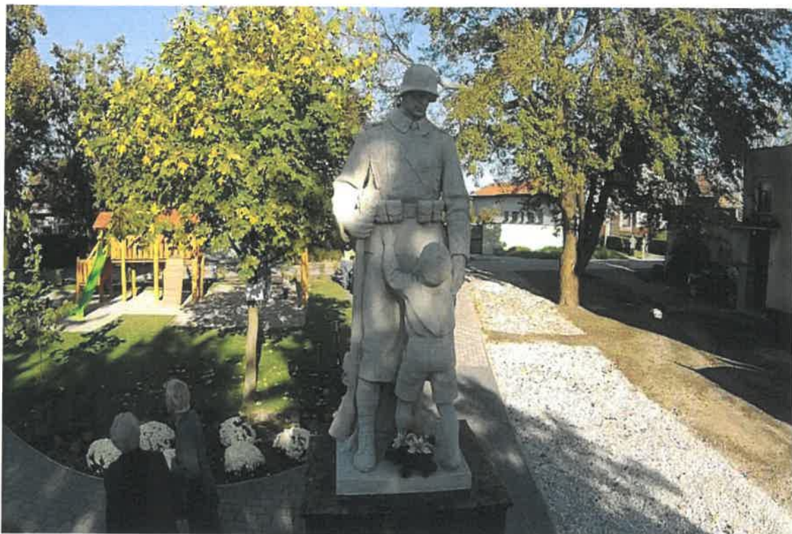
Socha – památník hrdinů I. sv. vojny