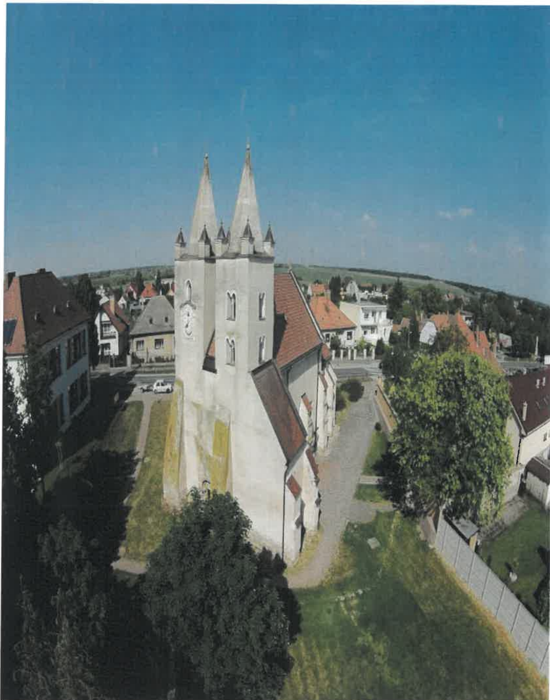
Rímsko - katolícky kostol Svätého.Jakuba – Národná kultúrna pamiatka