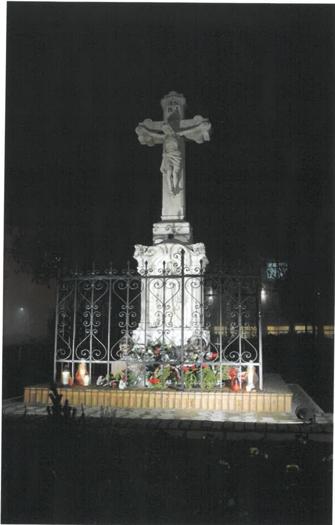
Socha Bieleho kríža