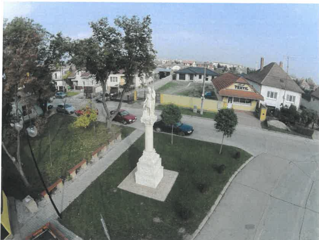
Socha Sv. Floriána