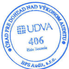
Zodpovedný audítor Mgr. Peter Šebest Licencia SKAU č. 960

BPS Audit, s. r. o. Licencia UDVA č. 406