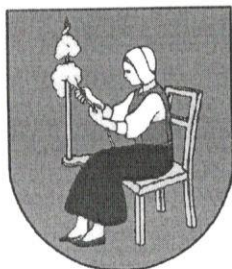
5.4 Logo obce

Symboly obce Varadka sú zapísané v Heraldickom registri SR.