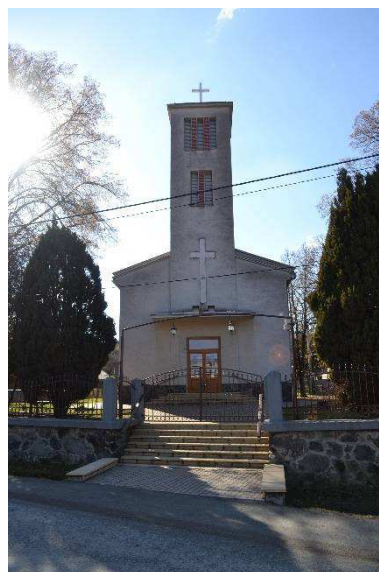
Rímskokatolícky kostol postavený v r. 1949