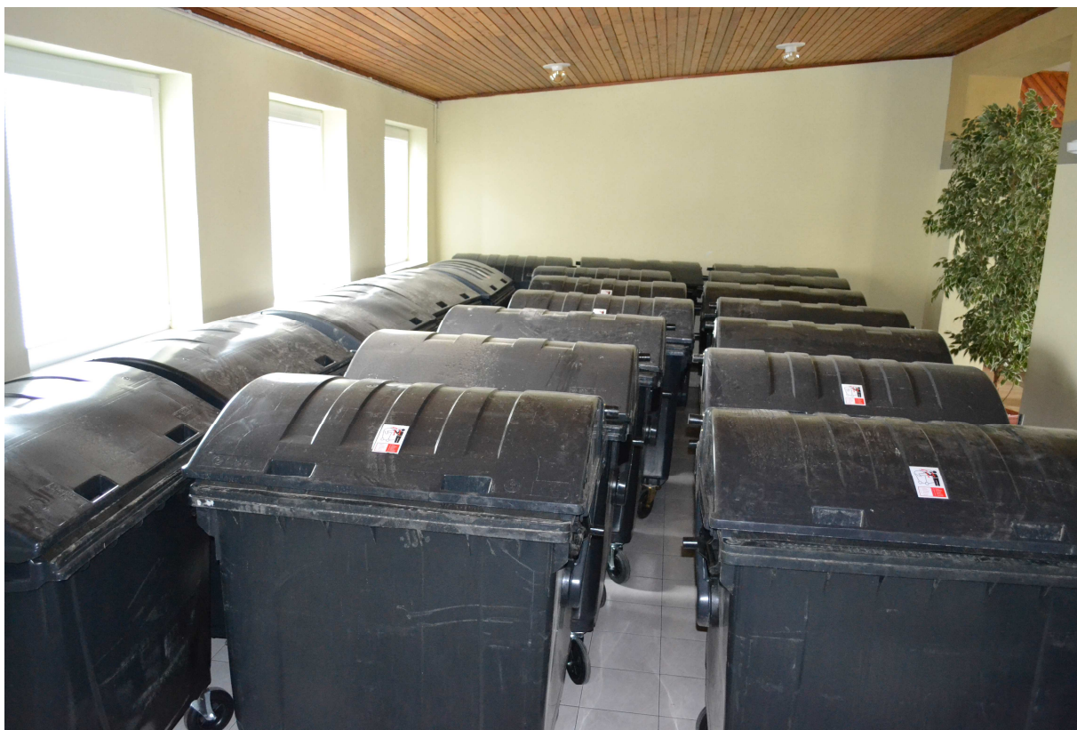
20 kontajnery plastové čierne 1100 litr