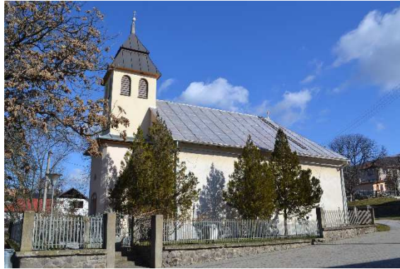
Reformovaný kostol postavený v r. 1792

Podľa sčítania obyvateľstva z roku 2011 86% obyvateľov je členom Rímskokatolíckej cirkvi, 7,2% obyvateľov je členom Reformovanej kresťanská cirkvi