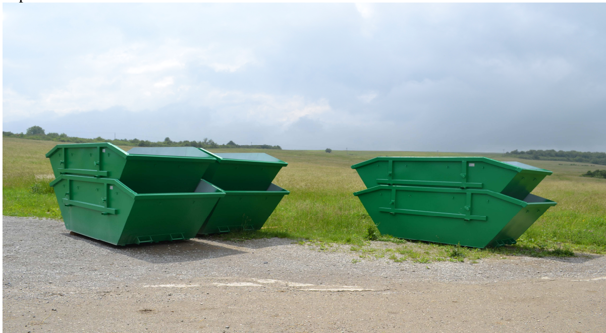
6 veľkokapacitné kontajnery 7,5 m 3 otvorené

V roku 2020 Obec Skároš nadobudla do vlastníctva kontajnery v rámci projektu Zberný dvor Skároš . Projekt bol financovaný z Európskeho fondu regionálneho rozvoja vo výške 12 061,20 €, spoluúčasť obce bola vo výške 634,80 €. Konkrétnym cieľom je „Rast počtu rómskych domácností s prístupom k zlepšeným podmienkam bývania“, oblasť intervencie: „Nakladanie s domovým odpadom.“