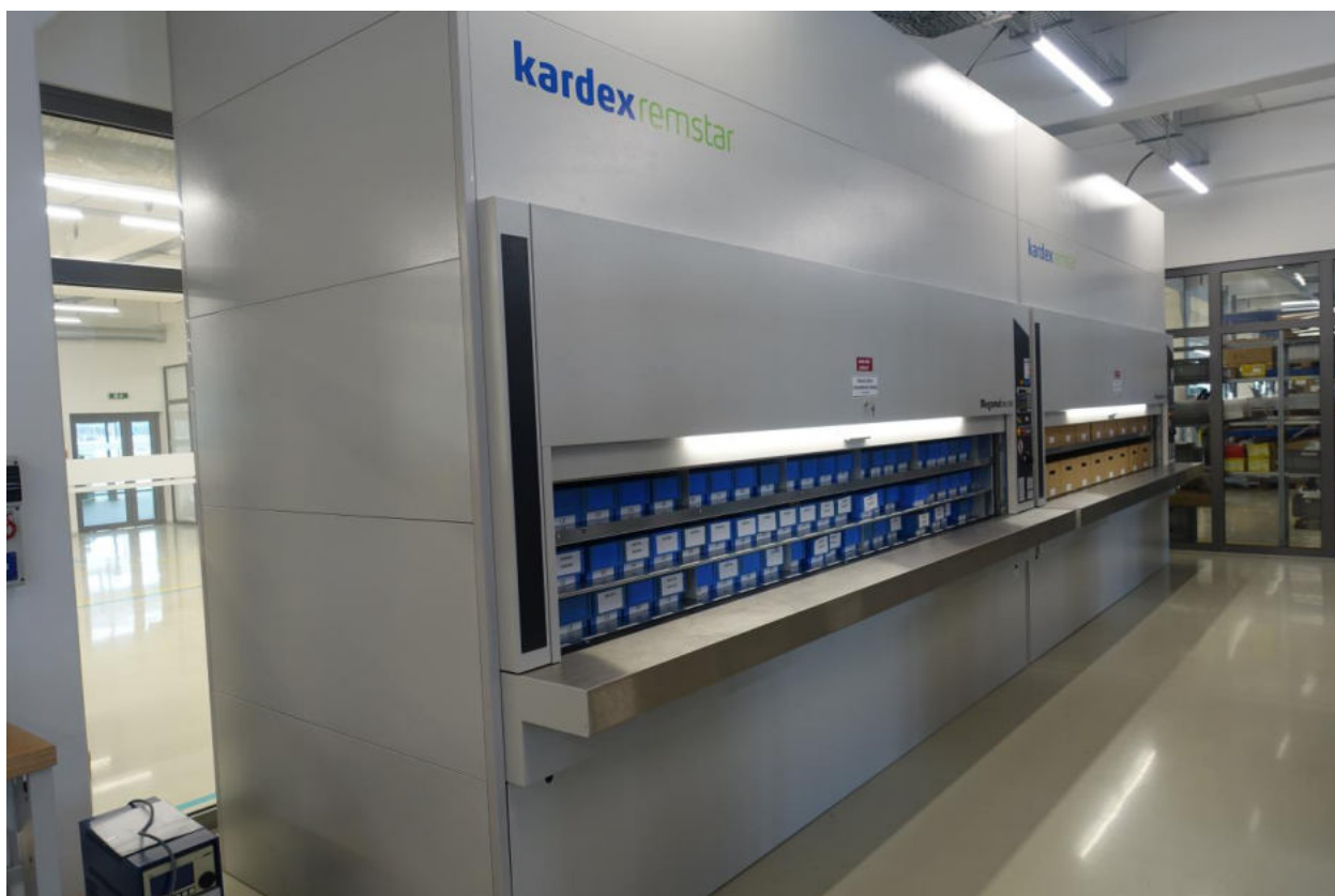
Foto: Automatizovaný skladovací systém Kardex Megamat RS350, Muehlbauer Automation s.r.o. Nitra.

Rok 2020 sa niesol v znamení výstavby novej budovy, ktorá bola úspešne ukončená v decembri roku 2020, s podanou žiadosťou o kolaudačné rozhodnutie. Prevažná väčšina nákladov roku 2020 sa týkala obstarania nábytku, vybavenia sociálnych miestností, šatní, zariadení informačných technológií, skladovacích systémov.