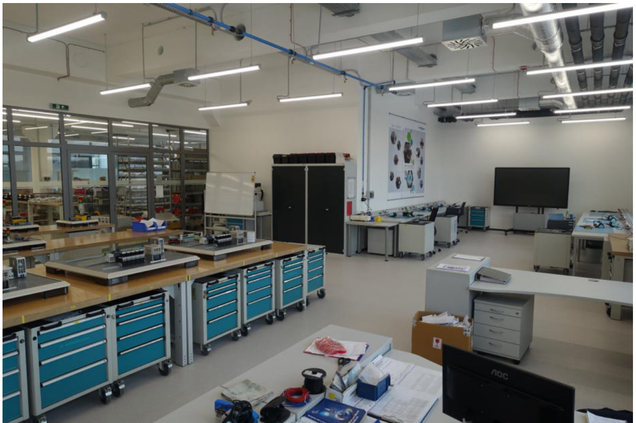
Foto: Cvičebná miestnosť pre duálne vzdelávanie, Muehlbauer Automation s.r.o. Nitra.

Školiace stredisko potvrdzuje status Pracoviska praktického vyučovania v Systéme duálneho vzdelávania a pretransformovalo sa z interného oddelenia na štátnymi orgánmi uznanú vzdelávaciu inštitúciu. Ako člen skupiny Muehlbauer patríme v celoštátnom meradle k lídrom na poli duálneho vzdelávania, do ktorého sme zapojení od roku 2019.