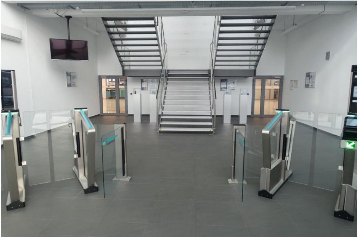
Foto: Vstupná hala, Muehlbauer Automation s.r.o. Nitra.

Rok 2020 bol ovplyvnený celosvetovou pandémiou COVID-19, ktorá však v podstatnej miere neovplyvnila činnosť ani hospodársky výsledok spoločnosti. Vedenie spoločnosti monitorovalo a podniklo všetky možné kroky na zmiernenie negatívnych účinkov na spoločnosť a jej zamestnancov.