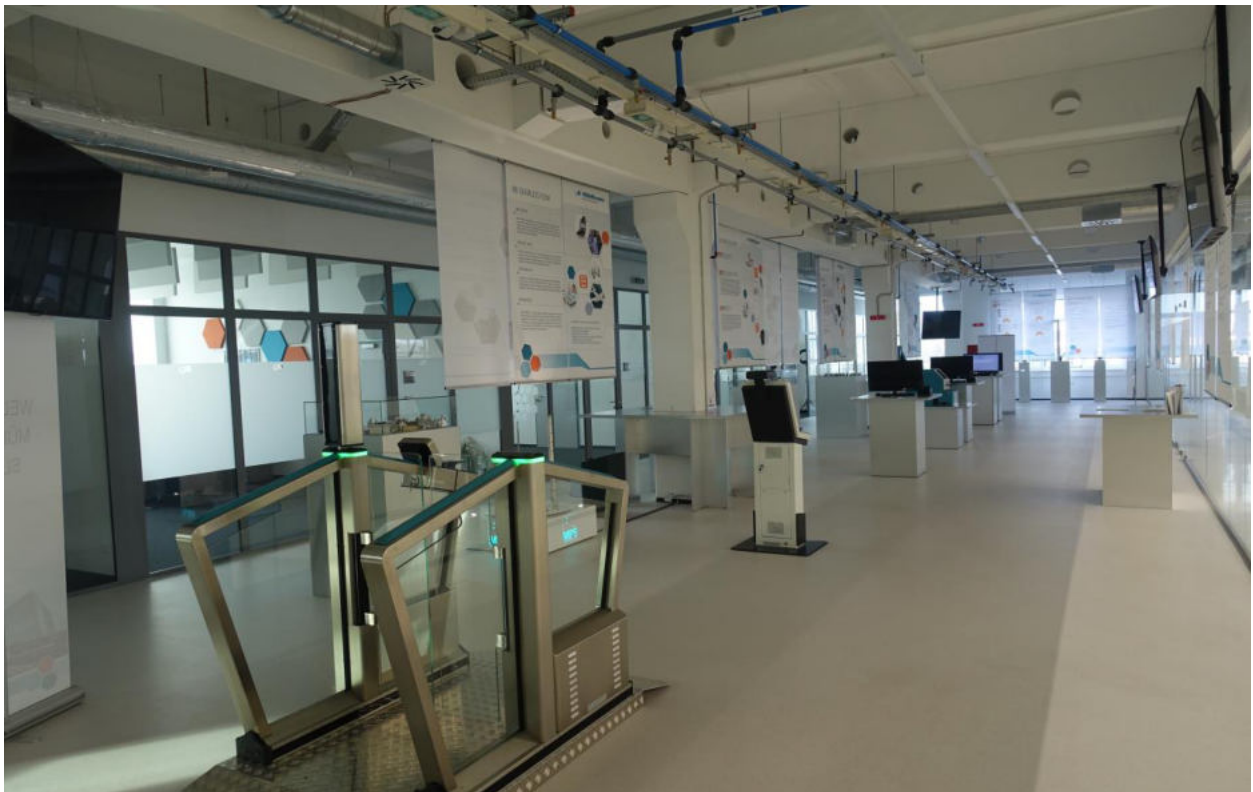
Foto: Demo room – Prezentačná miestnosť „od vytvorenia ID až po hraničnú kontrolu“, Mühlbauer Automation s.r.o. Nitra.

Mühlbauer RFID inlay systémy zahŕňajú všetky aplikácie ePassport a smart kariet, či už ide o formát ID-1, či ID-3 alebo aplikácie pre hybridné karty, karty s dvomi rozhraniami alebo bezkontaktné karty. Firma Mühlbauer ponúka so svojou sériou MTT strojov komplexné riešenie pre embedovanie RFID antén. Všetky procesy sú súčasťou jedného modulárneho systému: razeň a implementovanie čipov, ultrazvukové embedovanie antén, zváranie čipov termokompresiou, takisto ako aj testovanie, ktoré zahŕňa aj označenie chybných jednotiek. Inlay systém je základným komponentom pre výrobu smart kariet. Celosvetovo už bolo doručených viac ako 100 inlay systémov.