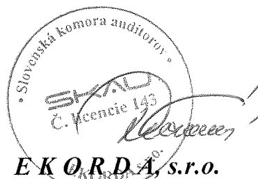
E K O R D A, s.r.o. Révová 45, Bratislava Licencia SKAU 143