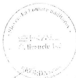
E K O R D A, s.r.o. Révová 45, Bratislava Licencia SKAU 143