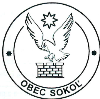
Obr. 2 Pečať Obce Sokol'

Pečať obce je okrúhla, uprostred s obecným symbolom a kruhospisom OBEC SOKOL'.