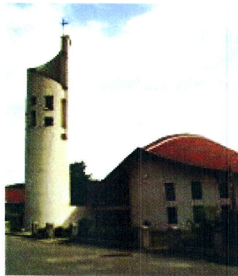
Obr. 5 Kostol Božského Srdca Ježišovho