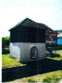
Obr. 4 Zvonica