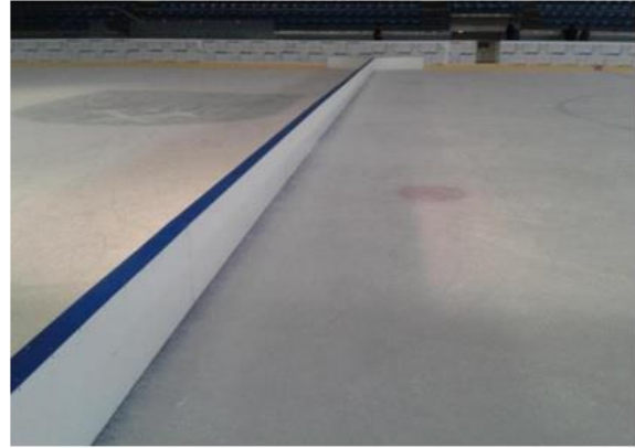
Ilustračné foto predelovacích mantinelov