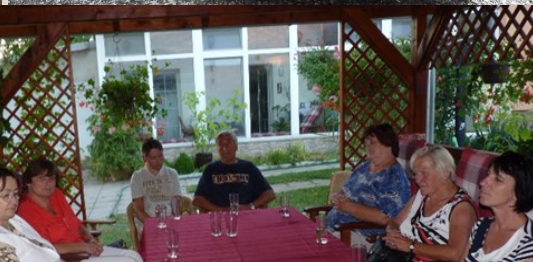
Konferencie v Košiciach—Šaci