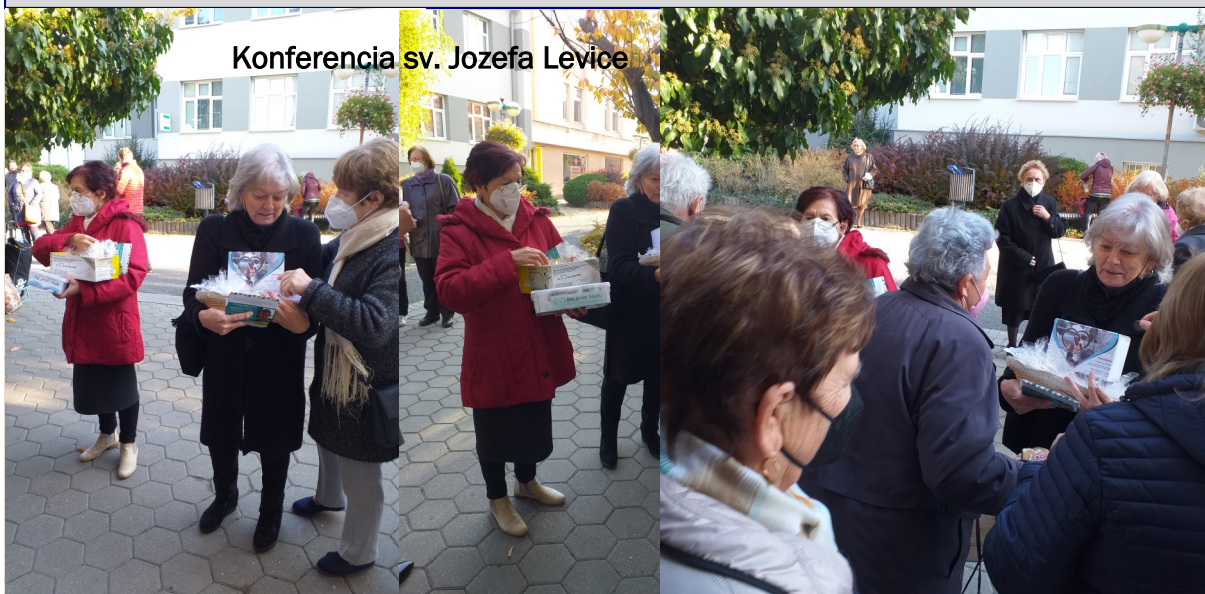
Konferencia sv. Jozefa Levice