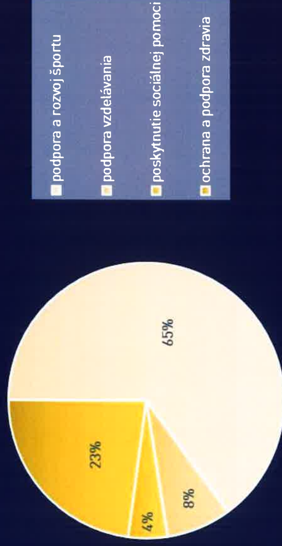
Graf č. 1: Percentuálne vyjadrenie poskytnutých príspevkov podľa oblasti a účelu podpory individuálnych žiadostí