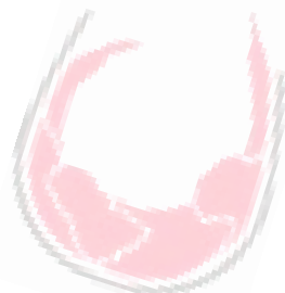
Schéma na podporu rodinného podnikania je preto zameraná na posilnenie konkurencieschopnosti a rastu slovenských rodinných podnikov pôsobiacich v regionálnom, národnom alebo medzinárodnom priestore. Vďaka podpore budú rodinné podniky schopné ekonomicky vhodnejšie nastaviť svoje podnikateľské zámery a bude taktiež znížené riziko ich zlyhania v procese alebo v dôsledku generačnej výmeny, prípadne transferu vlastníctva.

Významnú časť MSP tvoria rodinné podniky, ktoré vytvárajú podmienky pre rast pracovných miest a zamestnávajú znevýhodnených sociálnych skupín. V prípade rodinných podnikov je však kľúčovým faktorom ich udržateľnosť. Podľa dostupných štúdií len 30 % rodinných podnikov prežije po 2. generáciu, 10 – 15 % prežije po 3. generáciu a len 3 – 5 % prežije aj po 4. generáciu.