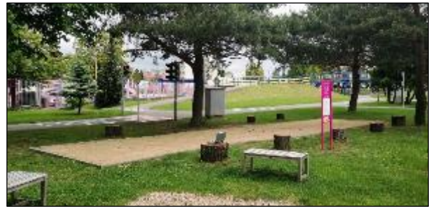
Obr. 67 Petangové ihrisko