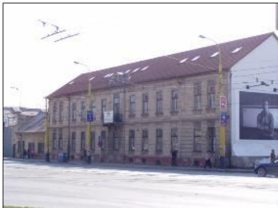
Obr. 11 Siposova továreň