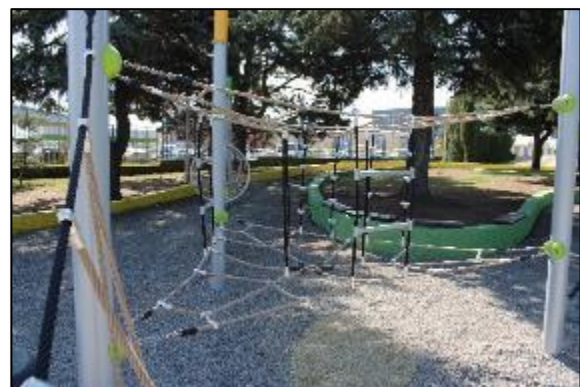
Obr. 5 Opičia lanová dráha ŠZA