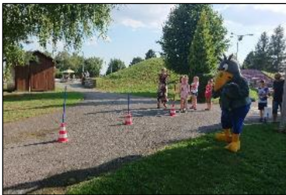
Obr. 4 popoludnie s maskotom Alejkom na ŠZA