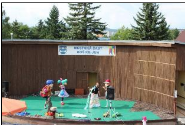
Obr. Alejko a krajina Haravara

Amfiteáter: s kapacitou 500 divákov bol zrekonštruovaný pre organizovanie kultúrno-spoločenských podujatí, sú v ňom vytvorené priaznivé podmienky pre organizovanie koncertov, festivalov, firemných a propagačných akcií, k dispozícii je javisko s ozvučením a zázemím ako šatne, hygienické a sociálne zariadenia pre verejnosť.