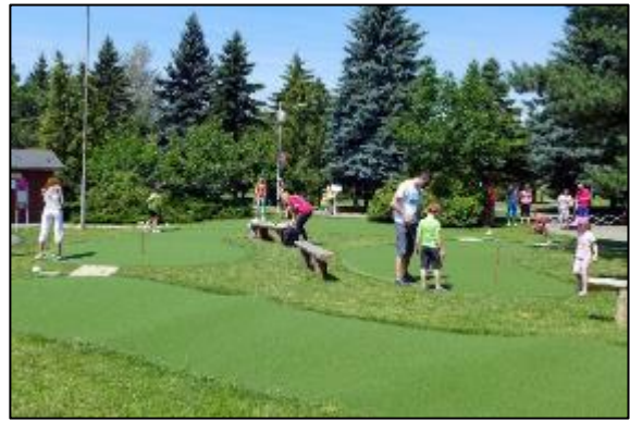
Obr. 54 a 55 Adventure golf

Budova areálu: v priestoroch budovy je k dispozícii bufet, detské hry, stolný futbal, tenis, mobilná knižnica a vonku letná terasa, na prvom poschodí sa pravidelne koná dopravná výchova pre deti spojená s premietaním po skončení dopravnej výchovy vedenej príslušníkmi polície. Budova sa dá prenajať k rôznym spoločenským podujatiam ako napríklad oslavy narodenín. Od roku 2016 si môžu návštevníci areálu zahrať v budove areálu billiard.