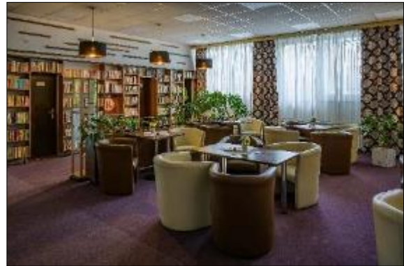
Obr. 3 Vstupný vestibul Jedálne pre dôchodcov