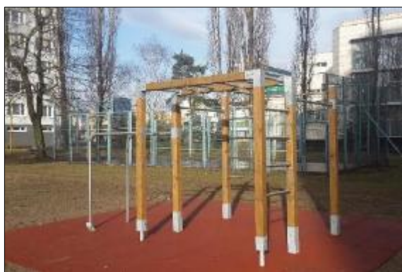
Obr. 37 Fitnes ihrisko Paláriková