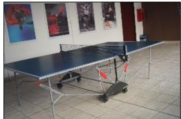
Obr. 68 a 69 Indoorové atrakcie – billiard a stolný tenis