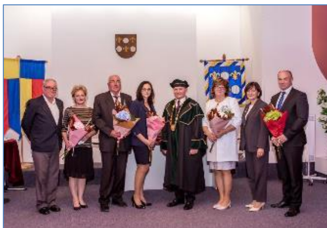
Obr. 19 Udeľovanie verejných ocenení

Kolektív fyzioterapie Kliniky úrazovej chirurgie UNLP Košice - za osobitný prínos v boji proti následkom ochorenia Covid - 19.