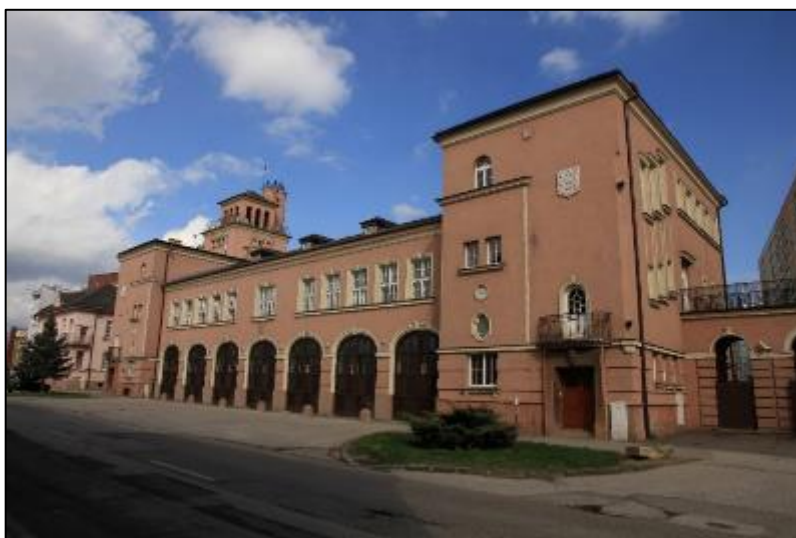
Obr. 14 Budova Okresného riaditeľstva hasičského a záchranného zboru