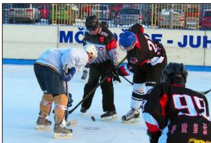
Obr. 49 Hokejový zápas