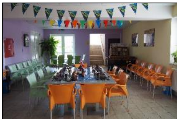
Obr. 63 a 64 Organizovanie detských osláv na ŠZA