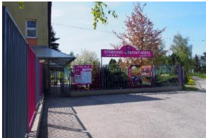
Obr. 56 Vstupná brána ŠZA

Budova areálu: v priestoroch budovy je k dispozícii bufet, detské hry, stolný futbal, tenis, mobilná knižnica a vonku letná terasa, na prvom poschodí sa pravidelne koná dopravná výchova pre deti spojená s premietaním po skončení dopravnej výchovy vedenej príslušníkmi polície. Budova sa dá prenajať k rôznym spoločenským podujatiam ako napríklad oslavy narodenín. Od roku 2016 si môžu návštevníci areálu zahrať v budove areálu billiard.