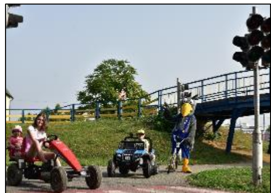
Obr. 45 a 46 Dopravné ihrisko