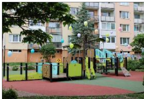
Obr. 36 Detské ihrisko Ludmanská