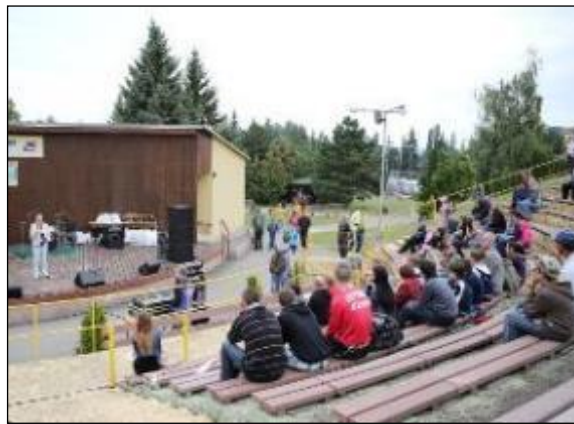
Obr. 51 Deň otvorených dverí – amfiteáter

Skate park: výstavba skate parku pre všetkých milovníkov tohto športu bola realizovaná v rokoch 2008 až 2009 a hneď od uvedenia do prevádzky si našiel svojich stálych športových nadšencov a návštevníkov.