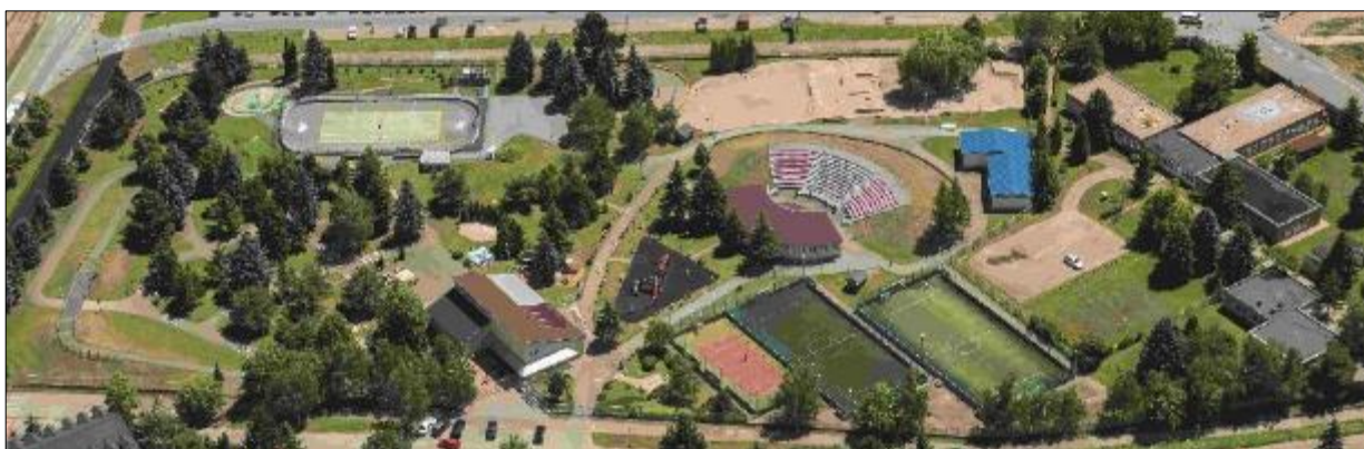
Obr. 42 areál ŠZA

Mestská časť Košice – Juh je vlastníkom a správcom Športovo - zábavného areálu na Alejovej 2 v Košiciach o rozlohe 22 546 m 2 , ktorý denne navštívi veľa detí, športovcov, občanov a návštevníkov mesta Košice. Areál je prispôsobený všetkým vekovým kategóriám – starší ľudia využívajú možnosť zahrať si stolný tenis, šípky, extérierové šachy, petanque, biliard. Stredná generácia využíva multifunkčné ihriská, skatepark, mobilnú ľadovú plochu, cvičenia TRX, externú posilňovňu. Pre najmladšiu generáciu je tu detské ihrisko, pieskovisko, preliezačky, hojdačky, trampolína, skákacia vranka. Pre všetky vekové kategórie je zaujímavý Adventure golf a altánok, ktoré umožňujú relax pre celé rodiny. Maskot areálu vranka „Alejko“ sa stala milou atrakciou na organizovaných podujatiach. V roku 2017 bola ľadová plocha kompletne zrekonštruovaná v hodnote takmer 95 tis. eur a aj vďaka tomu je možné povrch priestoru ľadovej plochy počas letných mesiacov využívať na ďalšie druhy športov ako napr. tenis, speedminton, či hokejbal. V roku 2019 sme sa stali nositeľmi slovenského rekordu za najviac športovísk a aktivít na jednom mieste. Športovo – zábavný areál má ako jediný na Slovensku 45 možností športovania, k dispozícii je ešte 13 ďalších podporných aktivít. V roku 2020 sa doplnila nová detská atrakcie v podobe 6 metrovej veže s veľkým tobogánom a šmýkalkou.