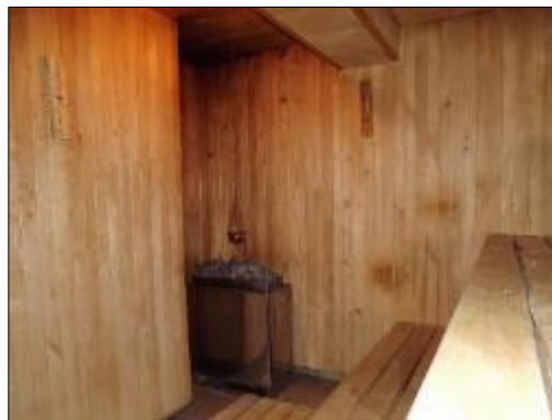
Obr. 40 a 41 Relaxačný bazén s vírivkami a sauna