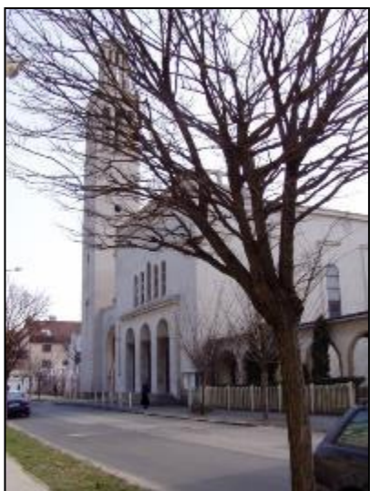
Obr. 13 Kostol Kráľovnej pokoja