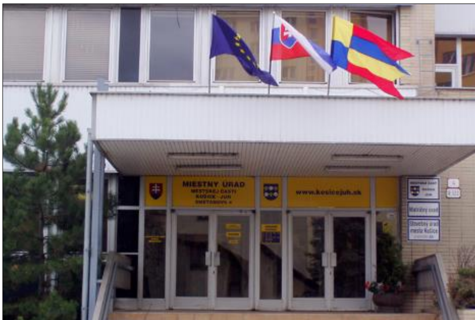
Obr. 9 Vstup do budovy MÚ MČ Košice – Juh, Smetanova 4

Obecný úrad: Miestny úrad MČ Košice - Juh, Smetanova 4, 040 79 Košice