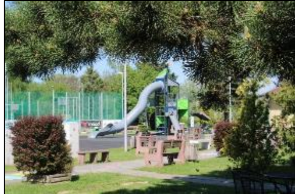
Obr. 44 Nová herná veža s tobogánom

Viacúčelové športové ihriská: v rokoch 2004 až 2006 boli vybudované tri viacúčelové ihriská s umelým trávnatým povrchom a umelým osvetlením s využitím na basketbal, volejbal, nohejbal, futbal či tenis, ihriská je možné využívať celoročne, sú oplatené a vybavené brámkami, basketbalovými košmi a k dispozícii je aj požičovňa športových náradí. V roku 2018 sme vymenili starý opotrebovaný umelý trávnik za nový.