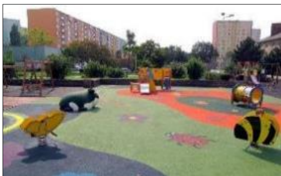
Obr. 33 Detské ihrisko Lienka