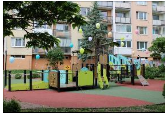
Obr. 7 Nové integrované detské ihrisko Modroočko na Ludmanskej