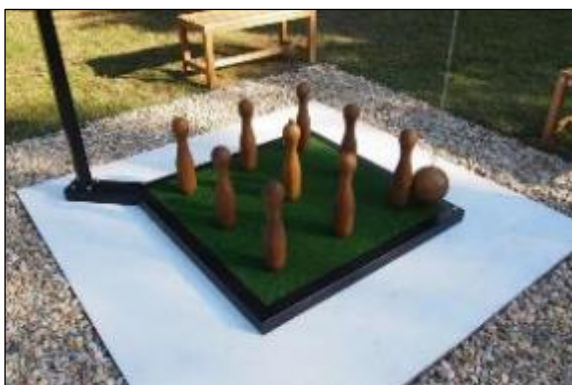
Obr. 61 Ruské kolky