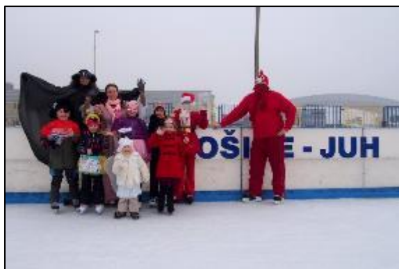
Obr. 47 Mikuláš na ľade

Ľadová plocha: v decembri 2006 bola sprístupnená verejnosti umelá ľadová plocha o rozmeroch 20x40 m s umelým chladením a osvetlením, je vybavená profesionálnymi mantinelmi, hokejovými brámkami, ochrannými sieťami a striedačkami, plochu je možné využívať od novembra do marca za predpokladu denných teplôt do +12 st. Celzia, využíva sa na verejné korčuľovanie, amatérsky hokej, tréningovú činnosť hokejových tried ako aj na športovo-zábavné akcie pre obyvateľov mesta Košice. V roku 2014 sme pre najmenších korčuliarov zabezpečili pomôcku na ľad – 2 pinquinov a 2 pandy, ktoré sú nápomocné deťom pri prvých krokoch na ľade. V lete je možné priestor ľadovej plochy využiť aj pre iné športové aktivity ako tenis, speedminton, streetbal, florbal alebo amatérsky hokejbal. V roku 2016 sa ľadová plocha stala po prvýkrát dejiskom Nonstop 24 hodinového korčuľovania, ktoré je spojené so zápisom do knihy Slovenských rekordov. Získali sme 2 slovenské rekordy v počte korčuliarov na ľade počas 24 hodín (1610 korčuliarov) a v počte nakorčuľovaných kilometrov počas 24 hodín (1298 km). V decembri 2016 sme vlastný rekord v počte korčuliarov na ľade prekonal (6043 km). Tento rekord je zapísaný aj v americkej knihe rekordov Record Setter. V roku 2019 sme rekord v počte nakorčuľovaných kilometrov prekonal a jeho výsledná hodnota je 8 986 km. Na úpravu ľadovej plochy sme vďaka finančným prostriedkom z mesta Košice mohli zakúpiť rolbu, vďaka ktorej je kvalita ľadu omnoho vyššia.