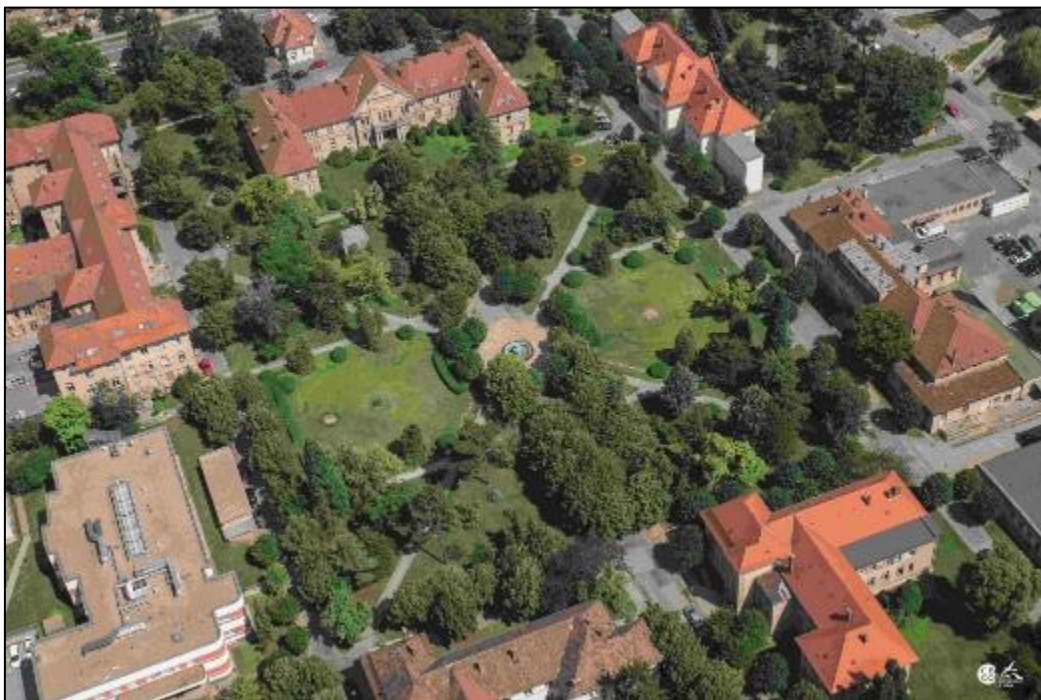
Obr. 17 Univerzitná nemocnica Louisa Pasteura

Francúzsky park je zvláštnosťou Univerzitnej nemocnice Louisa Pasteura na Rastislavovej ul. od jej založenia od r. 1924. Vyše 90 – ročná záhrada UNLP patrí k územiám s najvyšším stupňom ekologickej stability, je označovaná za pľúca Košíc a vytvára mikroklimu južnej časti mesta. Historický park UNLP Košice je posledný nemocničný udržiavaný starý francúzsky park na Slovensku.