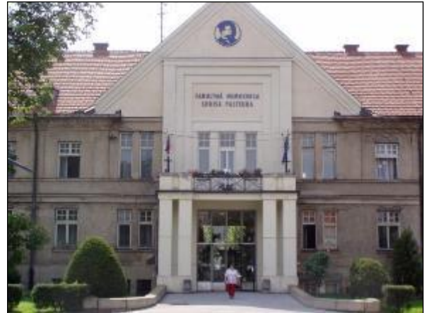
Obr. 16 Univerzitná nemocnica Louisa Pasteura

Francúzsky park je zvláštnosťou Univerzitnej nemocnice Louisa Pasteura na Rastislavovej ul. od jej založenia od r. 1924. Vyše 90 – ročná záhrada UNLP patrí k územiám s najvyšším stupňom ekologickej stability, je označovaná za pľúca Košíc a vytvára mikroklimu južnej časti mesta. Historický park UNLP Košice je posledný nemocničný udržiavaný starý francúzsky park na Slovensku.