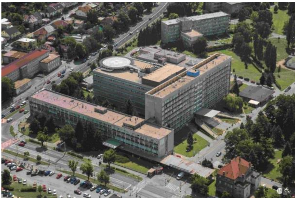
Obr. 20 Univerzitná nemocnica L. Pasteura

Zdravotnú starostlivosť v MČ Košice – Juh poskytuje: Poliklinika Juh Košice, Univerzitná nemocnica L. Pasteura, štátni a súkromní lekári.