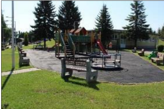
Obr. 43 Pôvodné detské ihrisko

Solutions Slovakia s.r.o. sa zmluvné strany dohodli od roku 2020 na zmene názvu areálu na #magentalife Športovo – zábavný areál.