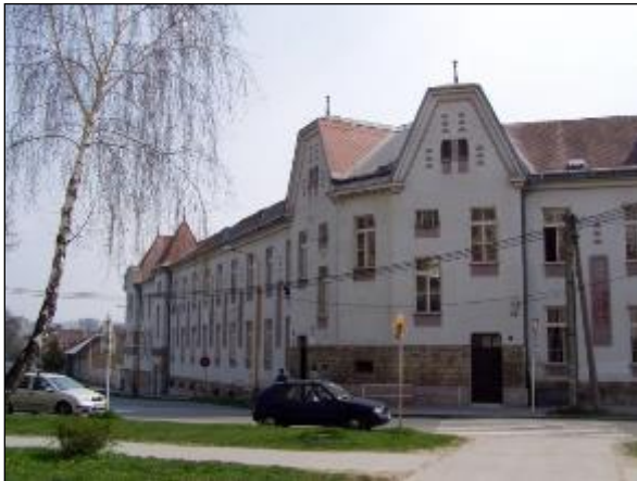
Obr. 15 Budova Strednej zdravotníckej školy

V polovici 19. storočia sa na území súčasnej mestskej časti začal prudko rozvíjať priemysel. Bolo postavených niekoľko tovární a továrničiek, napr. prvý košický cukrovar, Sipossova továreň na pletený tovar, továreň na počítačie a písacie stroje, Strojáreň bratov Szlovenszkých, továrne rodiny Ungárovcov, likérka Adler a Gold, továreň na koňak, likéry a rum, košická parná továreň na škrob a lepidlo, továrničky na nábytok, parkety, kávoviny, ale aj chemická čistiareň, pracovňa a továreň na mydlo. Medzi najvýznamnejšie patrila Strojáreň a zlieváreň Karola Poledniaka z prelomu 19. a 20. storočia, ktorej areál bol jedinou technickou historickou pamiatkou v mestskej časti.