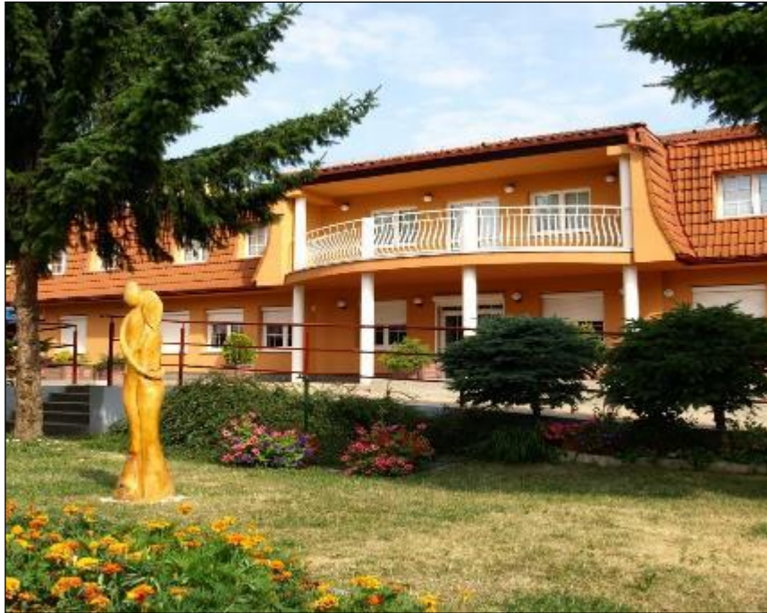
Obr. 39 Budova Spoločensko-relaxačného centra, Milosrdenstva 4

Denné centrum seniorov tak plní požiadavky občanov v oblasti záujmovej, kultúrnej a športovej činnosti, v snahe udržiavania fyzickej a psychickej aktivity občanov, ktorí sú poberateľmi starobného dôchodku alebo občanov s nepriaznivým zdravotným stavom.