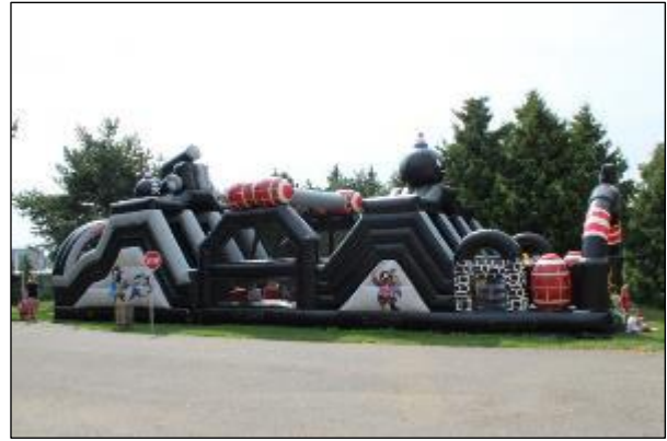
Obr. 65 Nafukovacia 18 m prekážková dráha