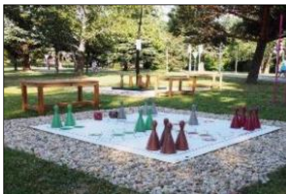
Obr. 62 Človeče nehnevaj sa