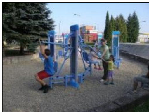
Obr. 58 Exteriérová posilňovňa