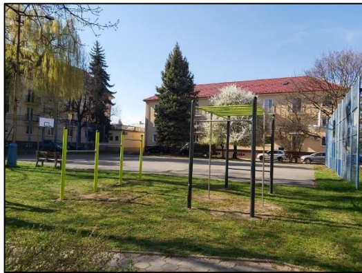
Obr. 6 Nové workoutové ihrisko Gaštanová