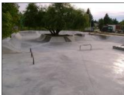
Obr. 52 a 53 Skate park

Golfové ihrisko: dňa 7. októbra 2013 sa slávnostne otvorila a začala prevádzka deväť jamkového Adventure golfu. Je to golf, ktorý sa hrá podľa pravidiel riadneho golfu, čím je atraktívny nielen pre amatérskych hráčov, ale aj pre golfistov hrajúcich na veľkých greenoch, na patovanie a to už v období, keď sa ešte golf nedá hrať na trávnatých ihriskách. Sedem jamiek je postavených na 2 páry a dve na tri. Aj keď sa zdá, že dráhy sú pomerne jednoduché, opak je pravdou, treba to len vyskúšať. Okolité prostredie golfových ihrísk je upravené tak, aby poskytovalo pre hráčov maximálnu možnosť na relax a športové vyžitie.