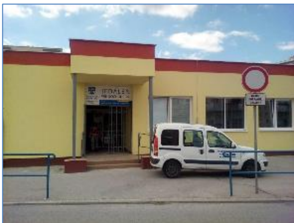
Obr. 23 a 24 Jedáleň pre dôchodcov, Vojvodská 5 po rekonštrukcii v roku 2016