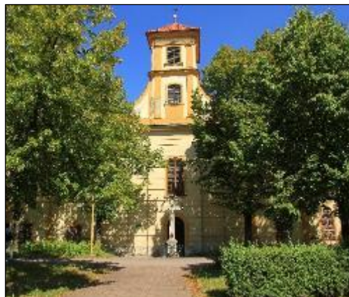
Obr. 12 Kostol Ducha svätého

Južná časť mesta sa začala formovať v období rozvoja obchodu ako prirodzené pokračovanie historického centra. Okolo vlastného územia stredovekých Košíc existovali menšie územné celky – prímestské osady, ktoré sa až do začiatku 16. storočia označovali ako villa, dorff, vicus, dörrfel. Na juhovýchodnom predmestí sa rozprestierala Ludmanova Ves (villa Ludmani, resp. Ludmansdörrfel) i Špitálska ulica; v juhozápadnej časti Bednárska Ves (Bindersdorf, či Bindergass).