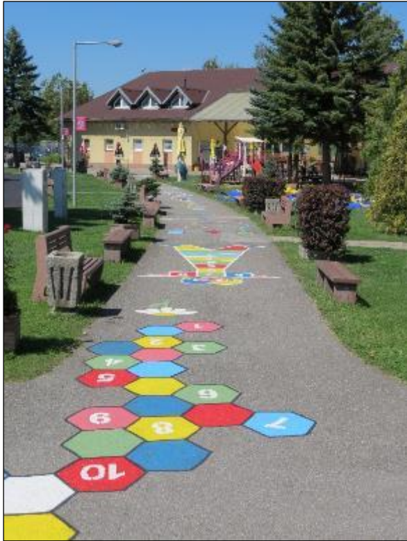
Obr. 66 Interaktívny skákací chodník