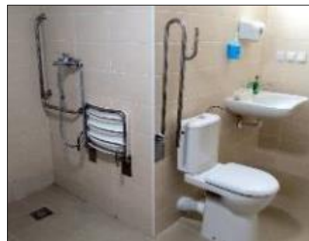
Obr. 29 a 30 Nové priestory ZOS na Mlynárskej 1 po rekonštrukcii