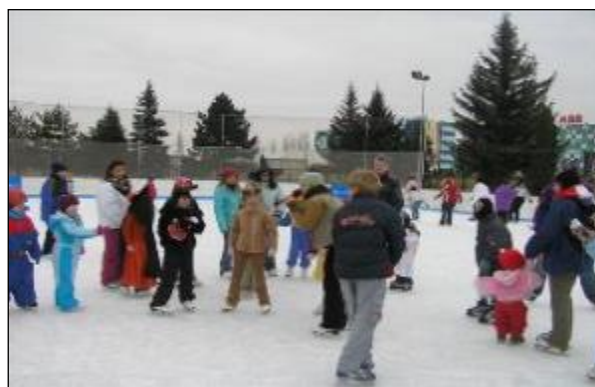
Obr. 48 Nonstop 24 hodinové korčuľovanie