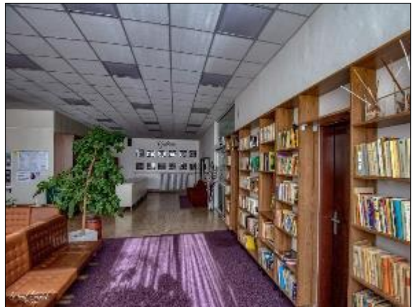
Obr. 25 až 28 Interiér Jedálne pre dôchodcov, Vojvodská 5 po úpravách v roku 2019 a 2020

MČ Košice - Juh v rámci iných sociálnych činností monitoruje nelegálne osady, poskytuje materiálnu pomoc občanom a rodinám v hmotnej a sociálnej núdzi formou poskytovania potravín.