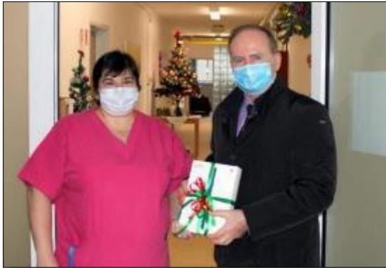
Obr. 2 Odovzdanie tabletu v ZOS