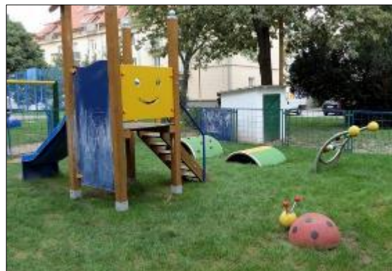
Obr. 35 Detské ihrisko Gaštanová