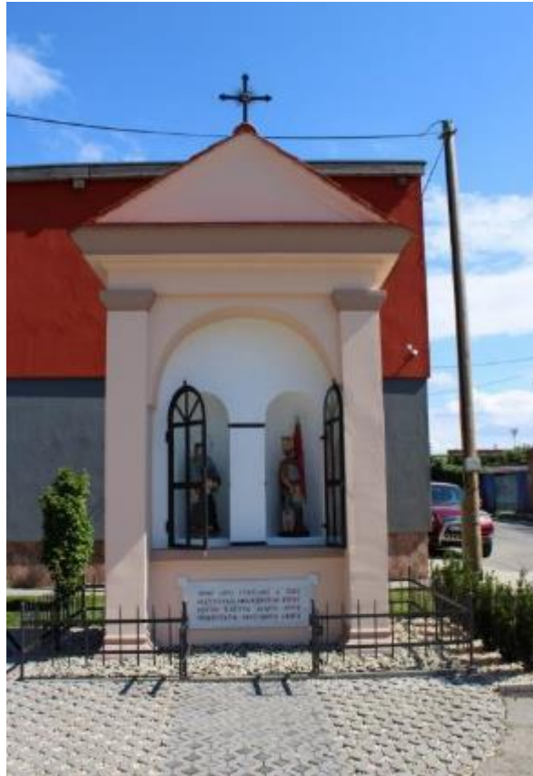
Obr. 18 Božia muka svätého Floriána a svätého Jána Nepomuckého

Božia muka svätého Floriána a svätého Jána Nepomuckého - pre tento typ sakrálnej stavby sa používa termín „božia muka“, od kaplnky sa líši tým, že nemá vnútorný priestor, do ktorého vojde človek. Bola postavená v roku 1826 ako odkaz na kresťanskú tradíciu odpúšťania dlhov a trestov za spáchané hriechy. Je vymurovaná z tehál a kameňa v klasicistickom štýle. V oblúkovite ukončenom výklenku sú vyhlbené dve hlbšie niky. V nich sa pôvodne nachádzali drevené sochy sv. Floriána a sv. Jána Nepomuckého. Svätci vytvárali klasickú zostavu ochrancov proti vode a ohňu.