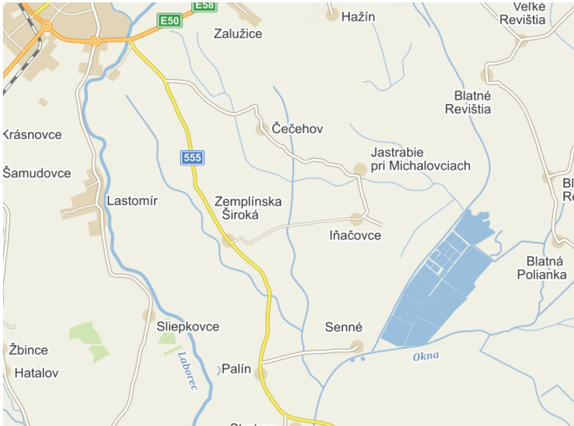
Obrázok 1 Mapa polohy obce

Nadmorská výška : Obec sa rozprestiera v nadmorskej výške 108 m. n. m.