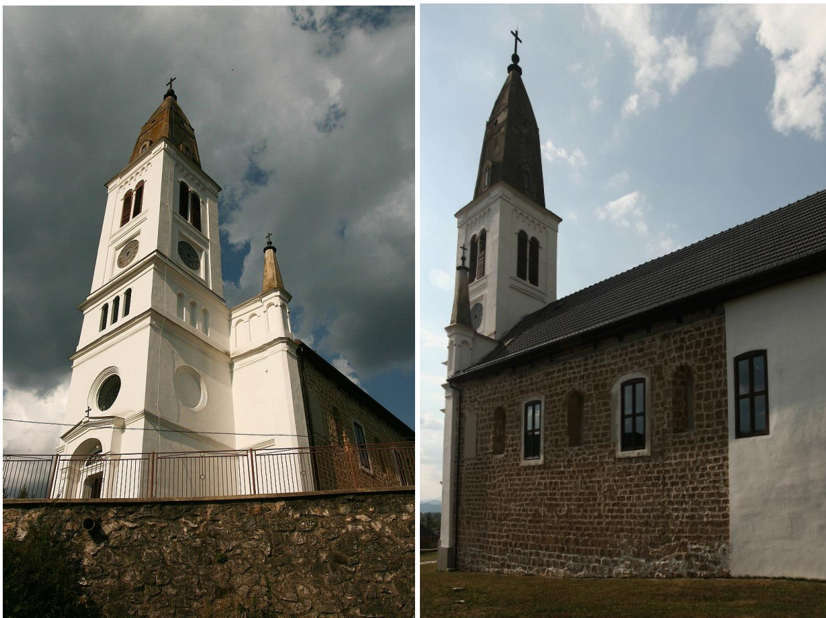
Kostol sv. Jána Krstiteľa

Katolícka fara -neskorobaroková stavba postavená v roku 1787