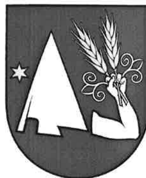
Obr.č.5 Vlajka, pečať, erb

Heraldická komisia Ministerstva vnútra Slovenskej republiky prerokovala návrh erbu obce Podlužany a odporučila ho na prijatie obecným zastupiteľstvom a na zaevidovanie do Heraldického registra SR v tejto podobe: