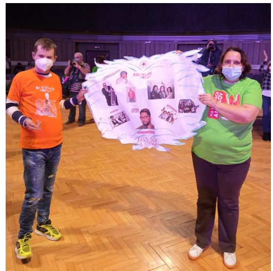
Na benefičnom festivale Na krídlach anjelov