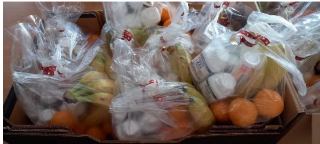
Balíčky s ovocím od sponzora Tesco