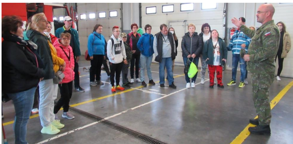
Prehliadka záchranných zložiek letiska Sliač