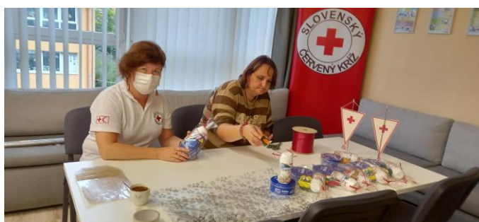
Príprava darčiekov pre seniorov

možnosť otvárať témy intimita a partnerstvo. V tomto mesiaci bol obnovený ďalší cyklus canisterapie, vedený certifikovaným terapeutom.