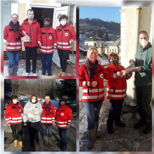
Na návšteve klientov s vianočnými balíčkami