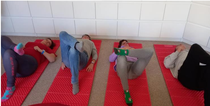
Pravidelné cvičenia v DSS