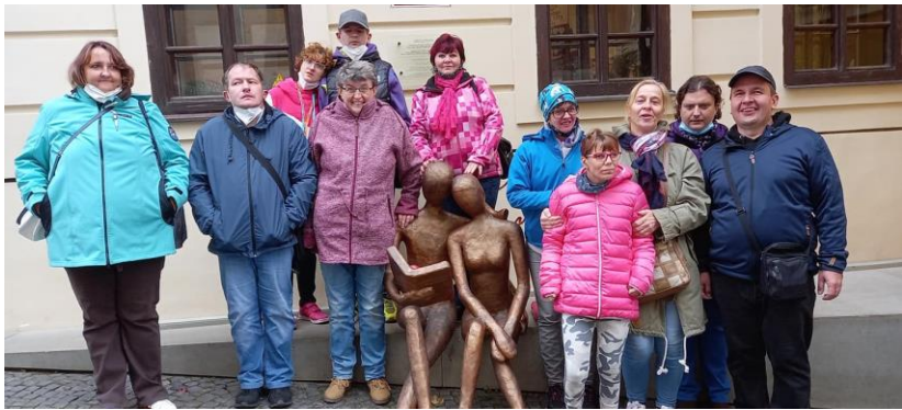
Na prechádzke v meste